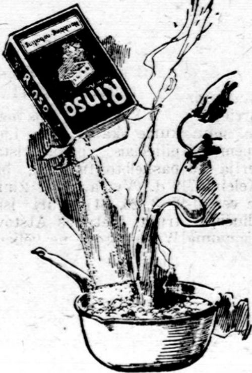
Vartok užtekinai Rinso, kad pasidarytų tirstos ir didelės putas, kurios paliuosuoja purvą.

Tegul mirkinimas atlieka visą jums darbą, vieton truputį. Mirkinimas tirstose, didelėse ir šiltose Rinso putose paliuosuoja visą purvą. Tik tas vietos, kur purvo labai daug yra, reikia patrinti su sausu Rinso ir purvo nei pėdsakų nelieka.