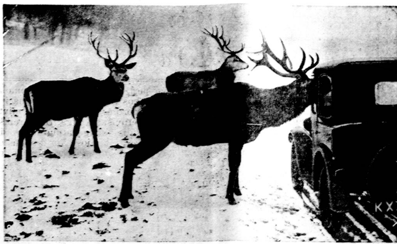
Anglijoje šmet irgi buvo sunki žiema. Sniego prisnigo taip daug, kad alkanos stirnos ėjo prie automobilių ir ėmė maistą iš žmonių rankų, kaip parodyta šiame vaizdely. Ši nuotrauka buvo padaryta Richmondo parke.