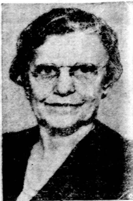
gubernatorius Merriam vedė atvaizdai. Kiekvienas senas.