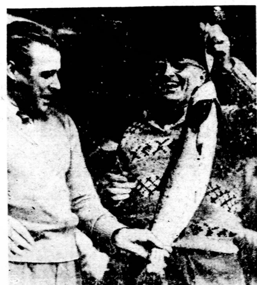
Prezidentas Trumanas rodo iškęles lašišą (salmoną), kurią vienas žuvininkas pagavo ir jam dovanojo. Šalia prezidento stovi senatorius Warren Magnuson.

laikai, gal jau mūsų kaulai pradės galvoti. Pamils laisvę pelenus bus pavirtę, bet vė ir vargu ar norės kužmonės susipras ir kitaip met išsizadėti.