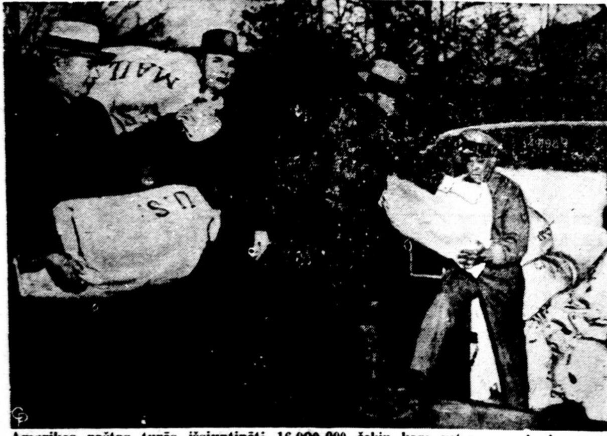
Amerikos paštas turės išsiuntinėti 16,000,000 čekių karo veteranams, kuriems nacionalinė draudimo įstaiga (valdžios įstaiga) išmoka "dividentus" arba permokėtus pinigus. Čia matyti, kaip pirmieji čekiai sukrauti į maišus gabunami į paštą, iš kur jie bus paskirstyti po visą kraštą.