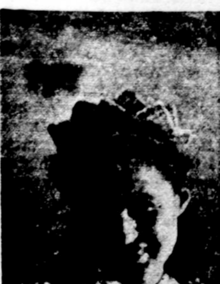
Jauna dainininkė, baigusi Kauno konservatoriją, dabar gyvena New Hampshire valstijoje. Ji ateinančių sekmadienį dainuos literatūros ir muzikos popietyje So. Bostone.