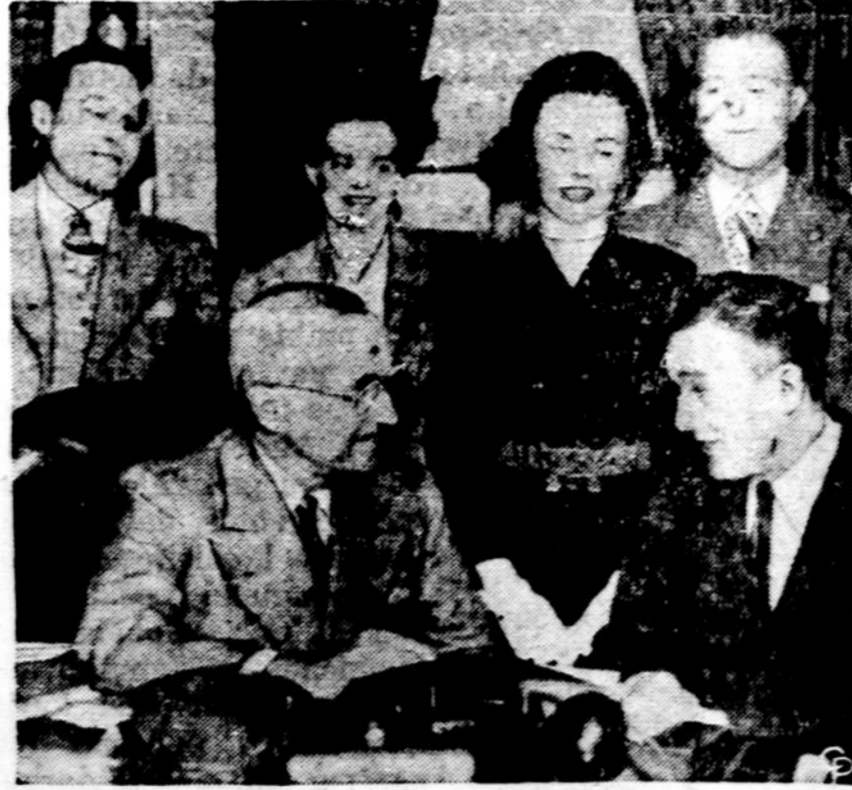
Naujai perrinkta jaunųjų demokratų klubų sąjungos valdyba lankėsi pas prezidentą Trumana jam persitaisyti. Siemet rinkimų metai, tai partijos mobilizuoja savo jaunimą politinei kovai.