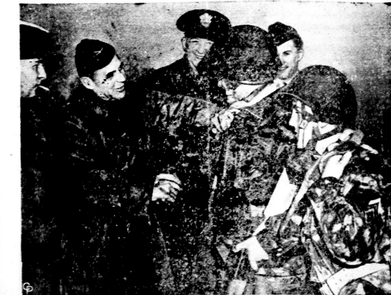
Atlanto šalių vyriausias karo vadas gen. Matthew Ridgway sveikina manevruose prancūzų parašutininkus, kurie puikiai pasižymėjo išsikilant kariuomenei Vokietijoje.

Pereitą mėnesį (rugsėjo) Amerikos vištos padėjo 4,108,000,000 kiaušinių, o rugpjūčio mėnesį jos padėjo 4,155,000,000. Prieš metus laiko rugsėjo mėnesį kiaušinių derlius davė 3,943,000,000 kiaušinių. Vidutiniškai per paskutinius dešimtį metų rugsėjo mėnesį kiaušinių "derlius" siekė 3,375,000,000 kiaušinių.