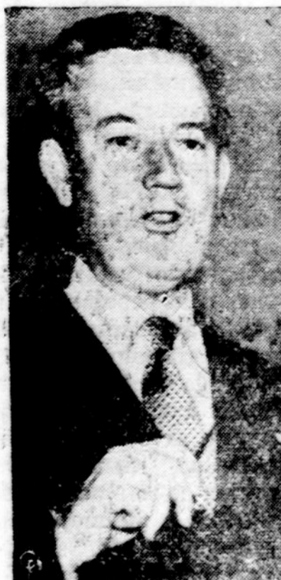
Senatorius John Sparkman, demokratų kandidatas viceprezidento vietai, parodė savo pajamas už 8 metus. Jos siekė $89,497 ir už jas jis sumokėjo $18,411 taksu. Zadedėjo parodyti pajamas ir gen. Eisenhower.