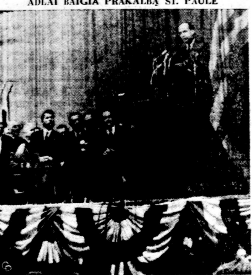
Gub. Stevenson, demokratų kandidatas, baigia savo prakalbą St. Paul mieste ir įspėja, kad patys dešiniausieji republikonai paims vadovauti kongreso komisijoms, jei republikonai laimės šio rudens rinkimus.

Palmiškos dziovintos Uogos yra gerai dėl tu, kurie turi užsinejusiu salčių galvoje, erzinančių skaudėjimų kvėpavimo kanaluose, kaip tai nosyje ar gerklėje. Palmiškos Uogos yra išdiovintos taip, kaip dziovintos slyvos, ir jas taip galima valgyti kaip dziovintas vintas slyvas, ir yra gerai vartoti arbatos formoje. Palmiškos Uogos yra labai maistingos, ir yra gerai tas Uogas valgyti dėl viso kuno pagerinimo. $2.00 svaras. O jeigu norite per C.O.D., tai $2.25 svaras. ALEXANDER'S CO. 411 W. Broadway South Boston 27, Mass.