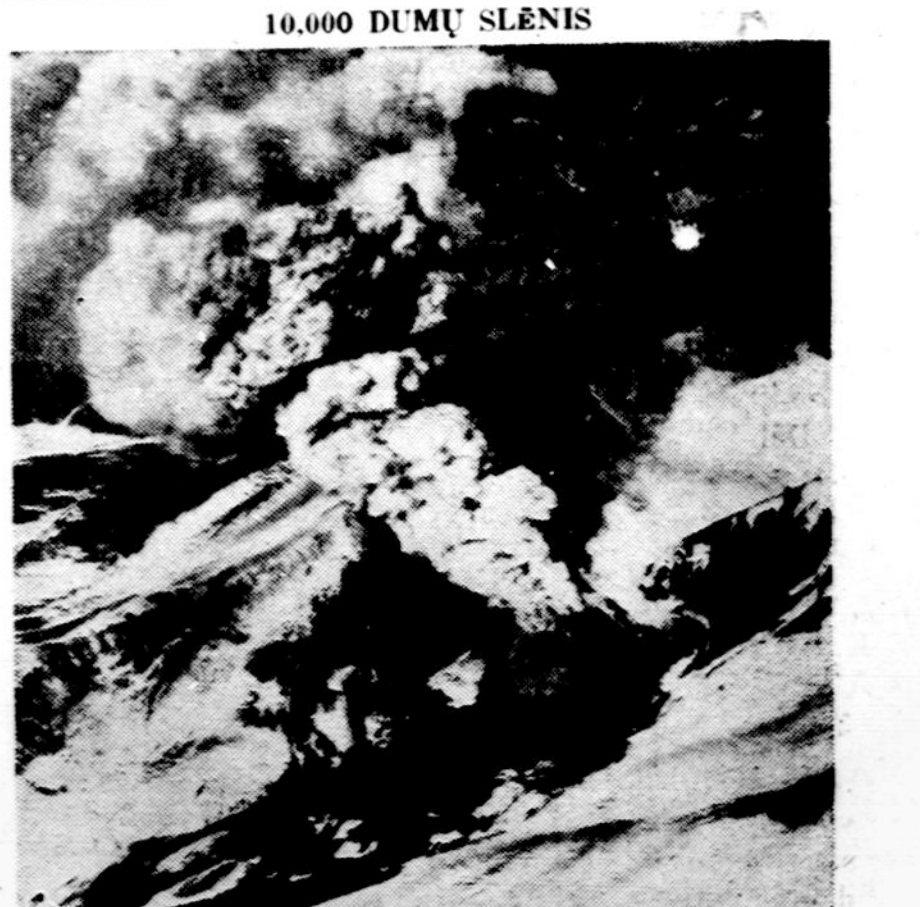
Alaskoje, Katmai Nacionaliniame Parke, yra aukštas Trident kalnas, kuris dabar virto vulkanu ir spiauna į aukštybes karštus akmenis, pelenus ir dumus. Kalno apylinkės yra vadinamos "10,000 dumų slėnis," nes jos yra apbrukusios. Netoliese yra dabar prigęsęs Vulkanas Katmai.

Oras pilnas kokio tai ruko ar miglų. Pievos žaliuoja, gėlės žydi—mums tik ką atvykusiems iš rytų atrodė lyg keista. Prieš astuonias nuvykom į kitą oro stotį, iš kur skrisim į Hawajus. Čia jau nuotaika visai kitokia: vyrų ir mergaitės, visi aerodromo tarnautojai, turi ant kaklų užsidėję gyvų gėlių vainikus, per radio skamba havaiečių melodijos, įvairios dainos. Patarnavimas ir čia visur mandagus, lipėnus. Užsiregistravom ir užsirekomendavom, kad jau esam čia, gatavai pasiruošę skristi į Hawaii. Patikrinom rekordus ir pakvietė eit į kitą kambarį, kur vašina keliauninkus tropiškų vaisių skysčiu, pyragaičiais ir, jei nori, tai gali imti ir kavą. Astuntą valandą išėdom į orlaivį. Dar arti 3,000 mylių kelionės! Kaip skridom per Pacifiko vandenyną ir kaip buvom pasitikti Honolulu saloje, apie tai parašysiu kitą savaitę. A. Jenkins.