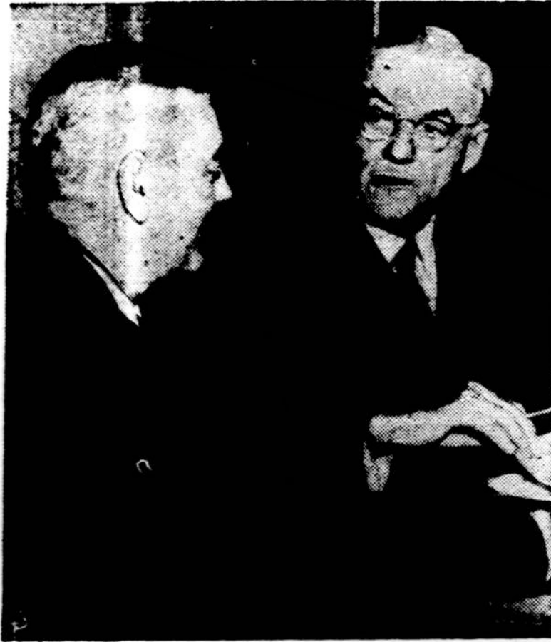
Čia matome valstybės sekretorių John Foster Dulles tartantis su savo padėjėju Herbert Hoover prieš išskrendantį į Atlanto sąjungos valstybių konferenciją Paryžiaje.