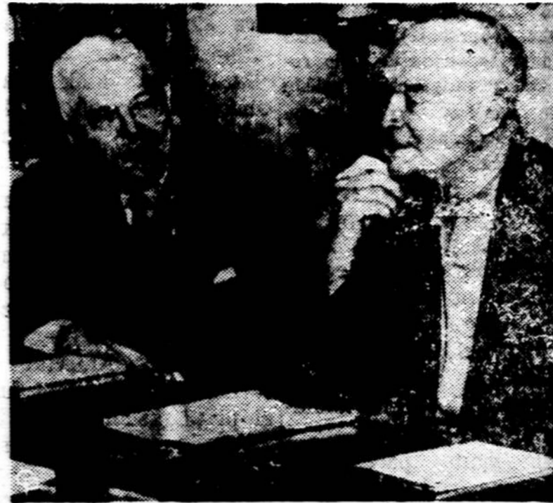
Prezidentas Eisenhower su krašto apsaugos sekretėria Charles Wilson svarsto krašto apsaugos išlaidas, kurių kitiems metams numatoma 38 milijonai dolerių.