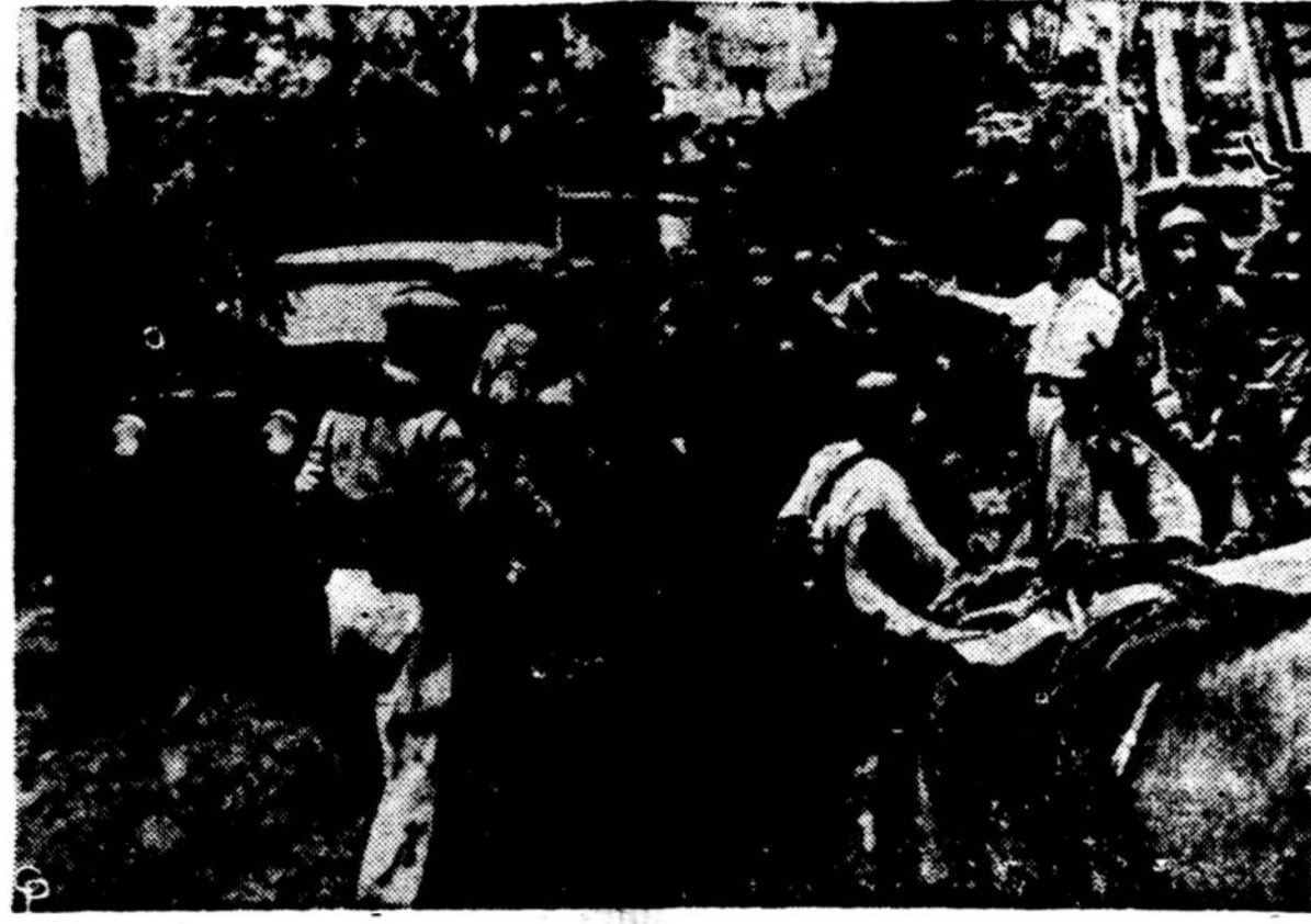
Prieš trejetą savaitę Kuboje buvo sukilimas prieš diktatorių Batista. Diktatorius skelbia maistininkus numalsinęs, bet kalnuose dar yra pasislėpusių gaus daug sukilėlių, kuriuos kariuomenė vis nepajėgia sugauti.

NATO valstybių pasitarimas perėitą savaitę Paryžiuje išrinko naują generalinį tos organizacijos sekretorių. Juo išrinktas Belgijos socialistų vadas ir dabartinis Belgijos užsienio reikalų ministeris Paul Henry Spaak. Naujas sekretorius gegužės mėnesį traukiasi iš Belgijos užs. reikalų ministerio vietos ir tada pradės eiti NATO sekretoriaus pareigas.