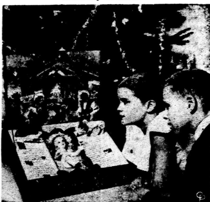
Zaislas, kuris pasakoja Kalėdų pasaką.