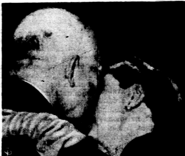
Prezidentas Eisenhower bučiuojasi su savo žmona, su-sitikę Augusta, Ga., kur prezidentas buvo nudykęs golfo palaštį.

Vaitiškis išsėjosi ir klausėsi namų vėjo ir auglių brandinančios žemės krabždėjimo. Lyg iš ilgos kelionės sugrįžęs, po ilgo nebuvimo, pajuto vėl iš naujo pasikartojant taip tvirtai taip giliai, kad krūtinę dusina. Ir atneša gaudulį, kaip arkligonų dainą.