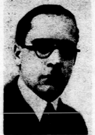
Gyvena Montevideo, Urugvaj, spalio 25 d. minėjo savo 60 metų amžiaus sukaktį.