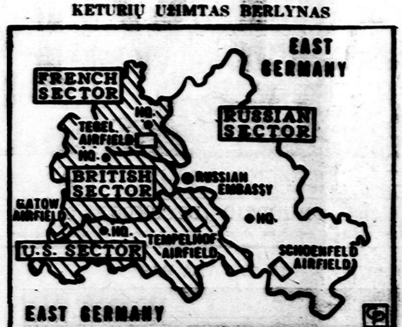
Rusai sako ištraukti savo kariuomenę iš Berlyno ir reikalauja, kad tą padarytų ir amerikiečiai, ir anglai ir prancūzai. Paveikslas rodo visas keturias Berlyno zonas. Rytuose rusų, šiaurėje prancūzų, pietuose amerikiečių ir tarp šių dviejų anglų. Taip valdyti Berlyną karai pasibaigus buvo sutarta visų keturių valstybių.

40 milijonų dirbančiųjų valstiečių Sovietijoje pagamina toli gražu neužtenkamai maisto 200 milijonų žmonių. Pagamina tik tiek, kad ir patys valgo dažniausiai duona ir bulves "užtaisytas" (užprovytas) Chruščiovo pažadais. Tuo tarpu Amerikoje 6 milijonai darbininkų žemės ūkyje, daugiausiai patys žemės savininkai, pagamina maisto 175 milijonams amerikiečių ir pagamina tiek, kad viso maisto krašte negalima sunaudoti. Maisto perteklius tenka parduoti užsieniams, o dalį tenka dovantoti užsieniams arba laikyti sandėliuose.