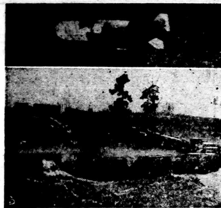
Apačioje matome keistą traukinį, kurį Amerikos kariuomenė gali naudoti ten, kur nėra jokių bėgių, tik sniego pusyns. Viršuje lėktuvas kūdikis, išmestas iš bombonečio B-52, kuris naudojamas prasiskverbimo operacijose.