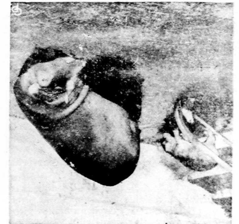
Kairė 40 svarų sveriantis upinis arklukas (hipopotamus), o dešinėje jo motina, sverianti 2000 svarų. Tas mažas hipopotamiukas šį pasaulį išvydo Bronx'o zoologijos sode New Yorke.