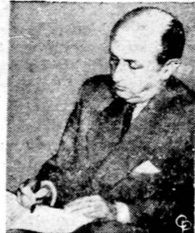
Pasaulinio Banko prezidentas Eugene R. Black pasirašo dokumentą, kuriuo Jungtinei Arabų Respublikai duodama 56 su puse milijonai dolerių paskolos Sueco kanalui praplėsti.

Plieno pramonėje ginčas tarp darbininkų ir darbdavių dar nėra išspręstas. Unija negali susitarti su darbdaviais, o vyriausybei labai rūpi tą konfliktą užbaigti.