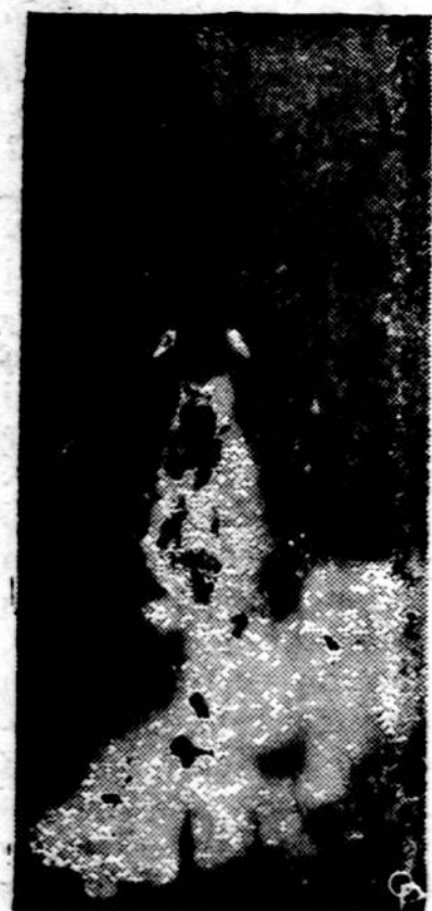
Iš Cape Canaveral, Fla., paleistos raketos Atlas kelionė baigėsi Indijos vandenynė. Ji per 52 minutes nuėkė 9.000 mylių. Vadinasi, nėra Sovietijoje tokio kampe, kurio ta raketa negalėtų pasiekti.