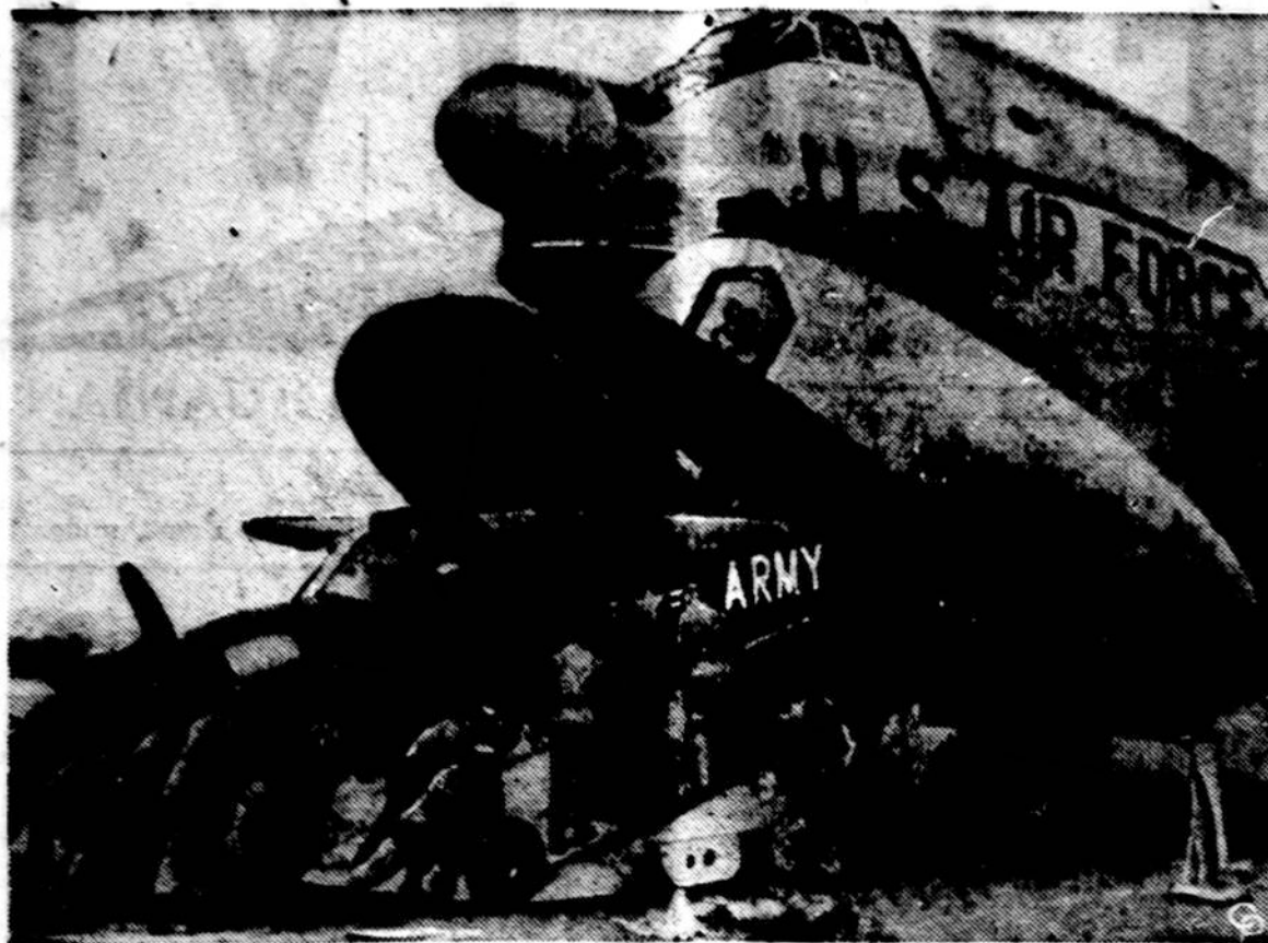
Jungtinės Tautos paprašė Ameriką aprūpinti į Kongo siunčiamą JT kariuomenę ten tvarkai palaikyti amunicija, maistu ir kitais reikmenimis. Čia matome, kaip į didelį lėktuvą Frankforte, Vokietijoje, pakraunamas mažas lėktuvas, skirtas Kongo respublikoje tvarką palaikanti JT kariuomenė.