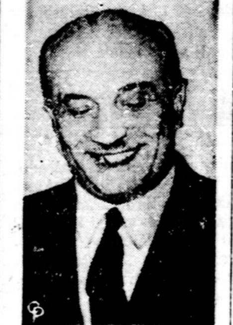
Jis sudaro naują Italijos vyriausybę. Jis yra k.d. partijos žmogus, bet linkęs kiek kairėn.

Šį pirmadienį Chicagoje prasidėjo republikonų partijos konvencija, kuri ketą užsitęsti iki ketvirtadienio.