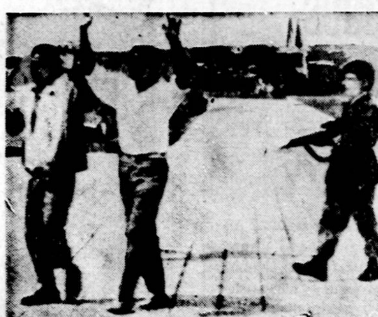
Belgų karys varo 2 vietinius gyventojus sostinės Leopoldville aerodrome. Belgų kariuomenė, kol atvyko JT organizacijos pajėgos, saugojo aerodromą, iš kurio baltieji galėjo aplieisti Kongo.