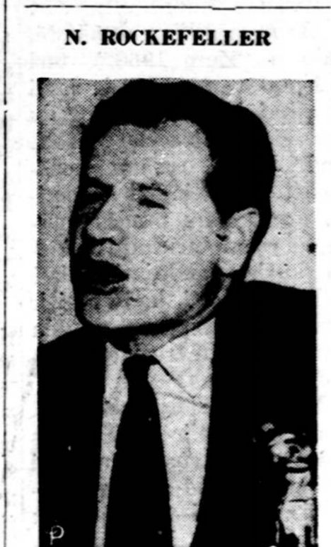
N. ROCKEFELLER Greit bus žinoma, ar jis bus republikonų partijos kandidatas viceprezidento vietai.

JIE ŠNIPINĖJA Čekų lėktuvai, skridami per Ispaniją į Gvinėją Afrikoje, mėgsta "nukrypti" nuo sutarto kelio ir lėkti virš Amerikos bazių tame krašte.