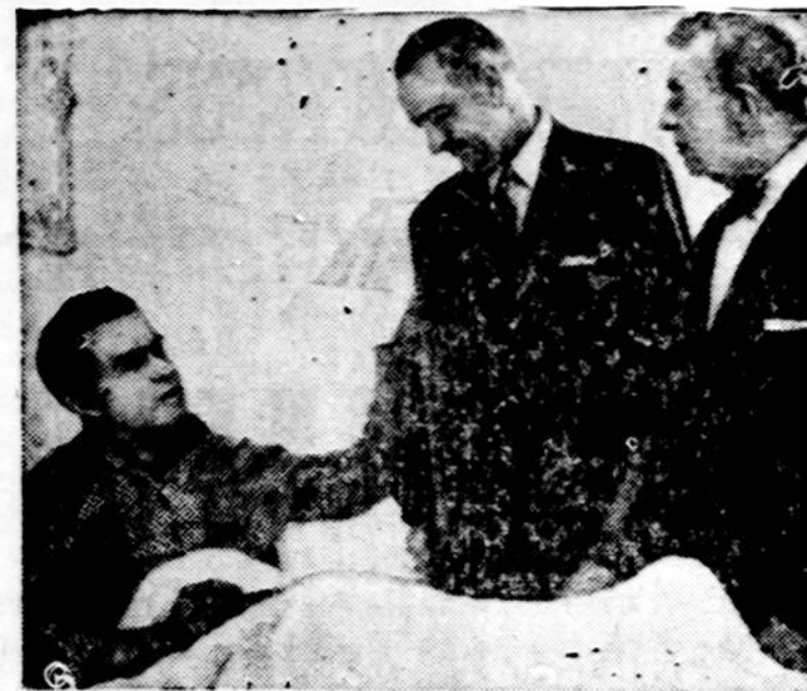
Demokratų kandidatas viceprezidento vietai sen. Lyndon B. Johnson, republikonų vado senate Everett Dirkseno (dešinėje) lydimas, aplankė republikonų kandidatą prezidento vietai Richardą Nixoną, kuris gulėjo ligoninėje. Nixonas praėitą savaitę išėjo iš ligoninės ir pradėjo rinkimų kompaniją.