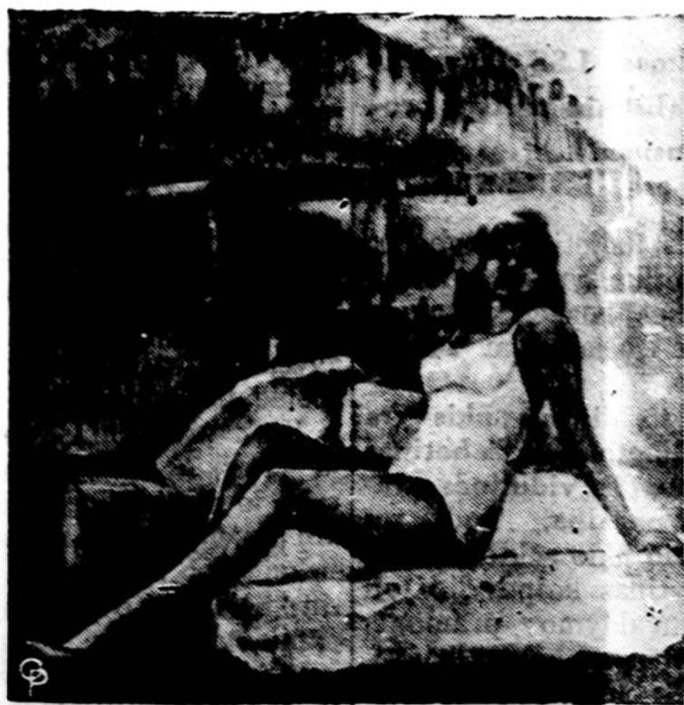
Grazuolių varžybų Miami, Fla., organizatoriai pasirūpino atvežti daug ledo, kad grazuolės galėtų atvėsti, nes temperatūra siekė virš 90 laipsnių. Čia matome vieną tų grazuolių, sėdinčių ant ledo.