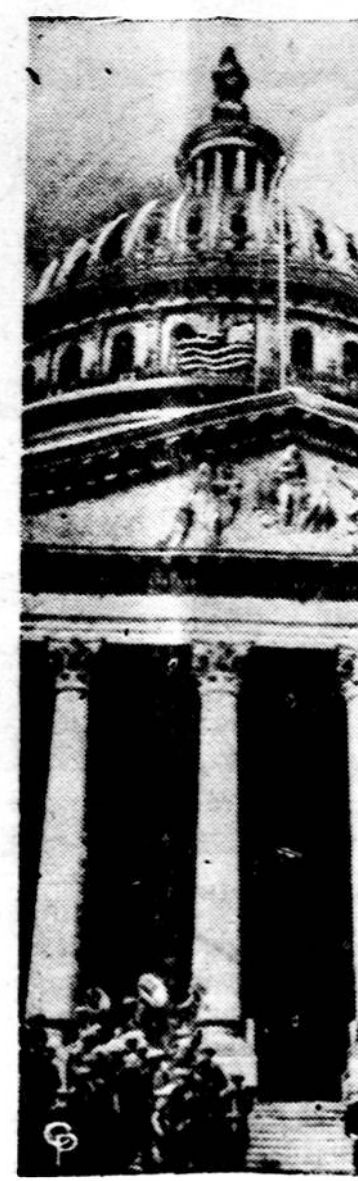
Amerikos vėliava su 50 žvaigždžių pirmą kartą pakyla Kapitolio praplėsintų ryto sparno fronte.