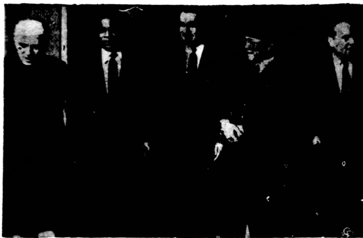
Jie, nežiūrėdami į Chruščiovo elgesį Jungtinėse Tautose, darė pastangų susodinti prez. Eisenhowerį ir Chruščiovą prie vie no stalo, bet pasisekimo neturėjo. Iš kairės į dešinę matome: Indijos ministrų pirmininką Jawaharlal Nehru, Ghanos prezidentą Kwame Nkrumah, Jungtinių Ara bū respublikos prezidentą Abdel Gamal Nasserį, Indonezijos prezidentą Sukarno ir Jugoslavijos prezidentą Tito.