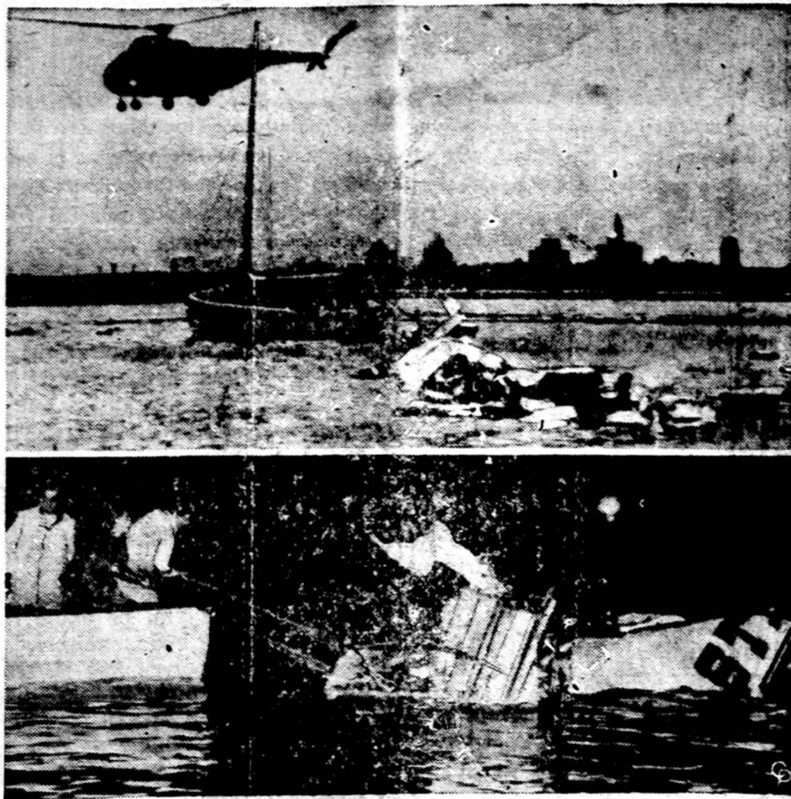
Praeitais savaitės antradienį iš Bostono a erodromo vos tik pakilęs lėktuvas Elektra, kuris turėjo skristi į Atlantą, nukrito į Bostono uostą. Iš 72 žmonių lėktuve žuvo 61. Keleivių tarpe buvo 15 marinių, ką tik įstojusių į marinių korpusą ir vykusių į karinę stovyklą. Iš jų tik vienas išsigelbėjo. Tokios nelaimės Naujojoje Anglijoje nebuvo buvę ir bendrai tai buvo viena iš didžiųjų lėktuvo nelaimių, pareikalavusių tokio skaičiaus aukų. Paveiksle matyti vieta, kur lėktuvas nukrito ir bandymas jį išvilkti iš vandens.