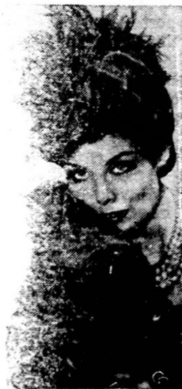
Taip, tai skrybėlė, kuri pritrinka 200 metų senumo muftai.