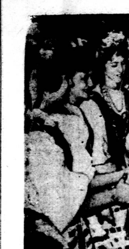
Lenkės įteikia prezidentui Eisenhoweriui gėlių, kai jis atvyko j Lenkų Susivienijimo kongresą Chicagoje pasakyti prakalbą.