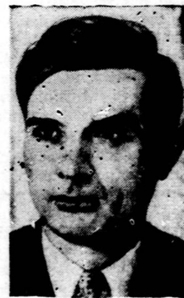
Maskva paskyrė žinomą komunizmo teoretiką Michailą Suslovą atstovauti komisijoje, kuri tirs Maskvos ir komunistinės Kinijos ideologinius skirtumus ir mėgins, jei galės, skirtumus išlyginti.