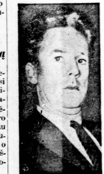
Aktorius Van Johnson Los Angeles teisme liudijo, kad jis nežino, kiek jis pinigų turi, kiek uždirba ir kiek išleidžia. Jo atsikyrusi žmona reikalauja $5,000 mėnesiui užlaikymo, o aktorius nežino, ar jis išgalės tiek mokėti...