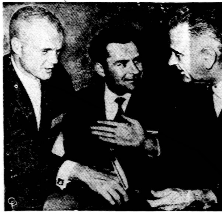
JAV viceprezidentas Lyndon Johnson (dešinė) kalbasi su kosmonautais: rusu Hermanu Titov (vidury) ir amerikiečiu John Glenn.