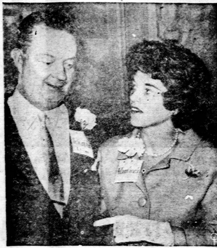
JAV prezidento sesuo, Taikos korpuso viršininko Sargent Shriver žmona, kalbasi su dr. Howard Rusk iškilinėse, kuriose buvo įteikti Albert Lasker medicinos žurnalizmo pažymėjimai. Ponia Shriver yra prezidento tarybos protinai atsilikusių klausimams nagrinėti patarėja, o dr. Rusk gydo prezidento tėvą, sveikstantį po širdies smūgio.