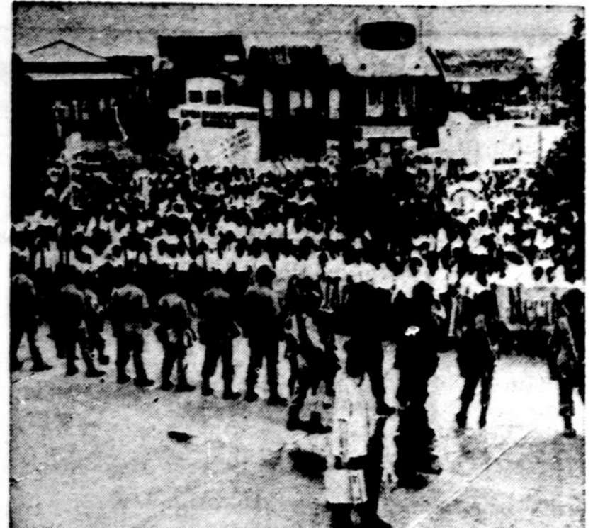
Panamos studentai demonstruoja nepatenkinti vyriausybės politika kanalo reikalu. Jie reikalauja statyti JAV griežtesnes sąlygas.

Užsakymus ir pinigų prašom siųsti šiuo adresu: "KELEIVIS" 636 E. Broadway — So. Boston 27, Mass.