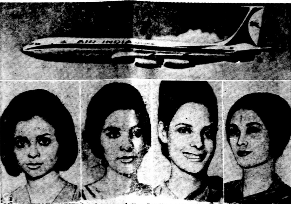
Viršuje lėktuvas, kuriuo popiežius Paulius VI skrido į Eucharistinį kongresą Indijoje. Apačioje to lėktuvo tarnautojos, visos indės.

Belaukiant sovietų politikos sušvelnėjimo ir kelias dienas čia turintis dėl sovietų ir JAV santykių išlyginimo bei kompromiso sovietų skoloms JT švelniai nuleisti į vandenį, sovietų užsienio reikalų ministeris Gromiko staiga Jungtinėse Tautose taip pat išdrožė prieš vakariečius vieną antrą, nors gyvena netoliese, bet prieš 12 metų juodu susižiėjo ir šiomis dienomis pirmą kartą susitikė.