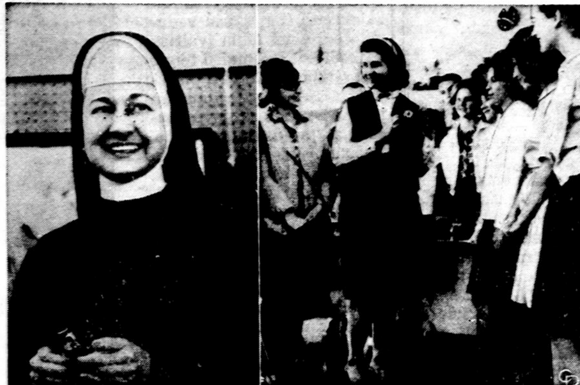
Mainos svieto margi rūbai — keičias ir vienuolių drabužiai. Kairėje vienuolė drabužiais, o dešinėje ji jau paprasta suknele apsilikusi tarp savo mokinių. Taip dėvėti jai leido jos viršininė.

Keleivio prenumeratą - gera dovana visokiomis progomis