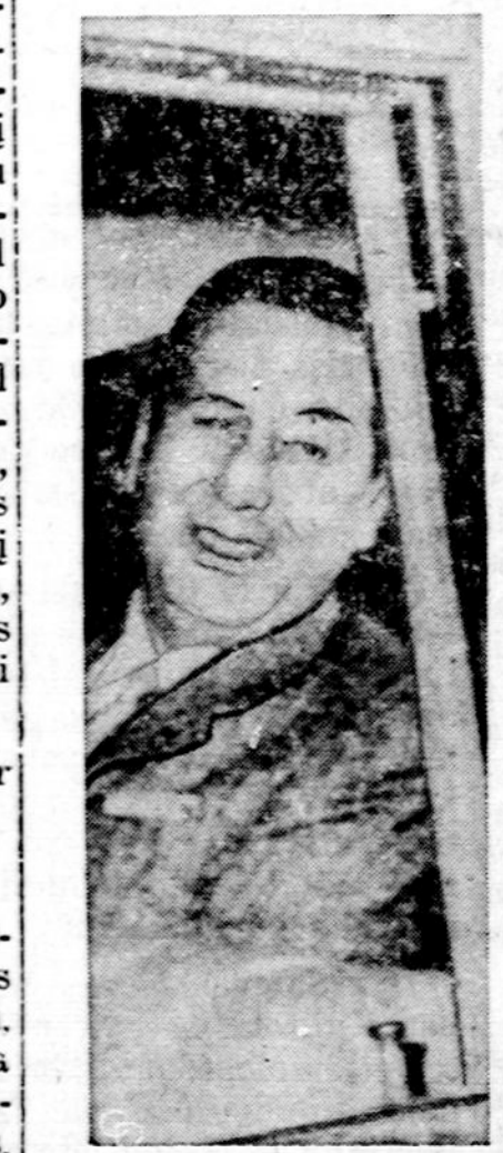
Buvęs Argentinos diktatorius Peron sutiko priimti Ispanijos salygas, būtent, nesikišti į politiką arba apleisti Ispaniją.

AUTOMOBILIAI UZMUŠĘ 34.000 ŽMONIŲ National Safety Council, kuri renka nelaimingų atsitikimų statistiką, praneša, kad per 9 šių metų mėnesius automobilių nelaimėse buvo užmušta 34,000 žmonių, tai yra 10 nuosimėjų daugiau, negu pernai užmušta per tokį pat laiką.