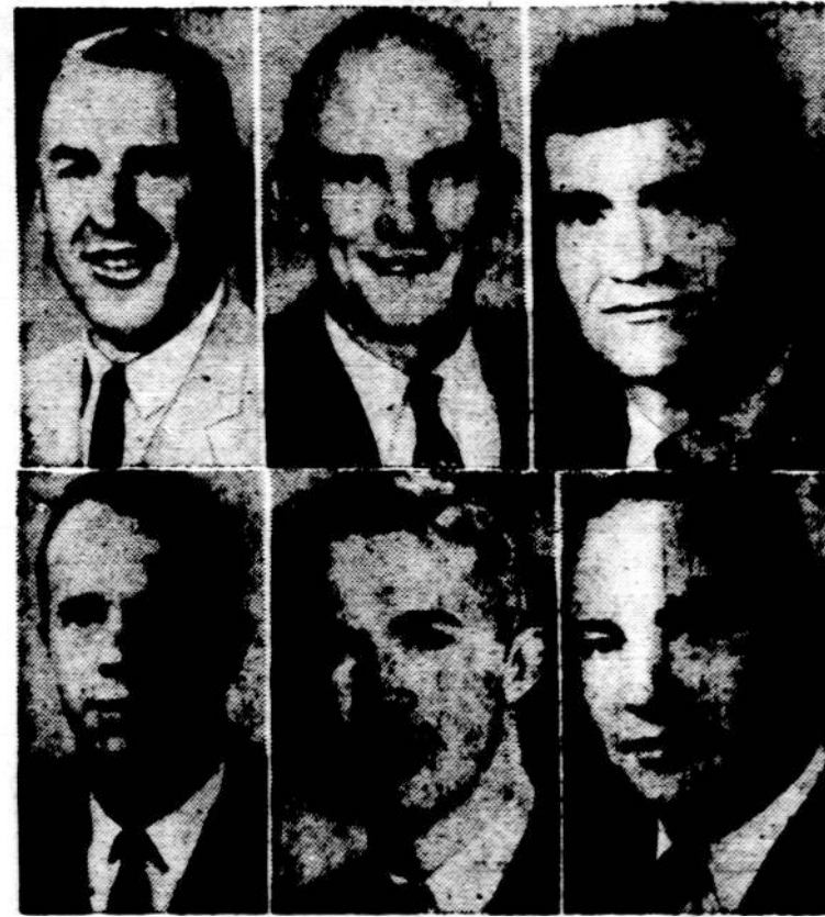
Šie nauji mėnulio astronautai, kurie NASA erdvės tyrimo centro numatyti atleisti į šį mūsų žemės palydovą. Viršutinėje eilėje tie, kurie skris mėnuliu Apollo 13, o apatinėje — Apollo 14. Apollo 14 vadovas Alan B. Shepard, Jr., yra pirmasis amerikietis, skridęs raketą.

Baigę karantiną, mėnuliu skride astronautai buvo labai iškilmingai pagerbti didžiuliuose JAV miestuose.