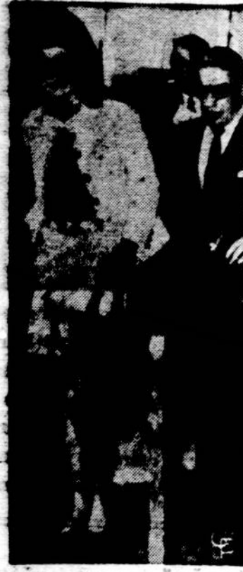
Jacqueline Onassis Paryžiuje. Laikraštis France d'Anche rašo, kad ji jau laukiasi kūdikio. Ji dar turi du buv. prezidento John Kennedžio vaikus — John ir Caroline.