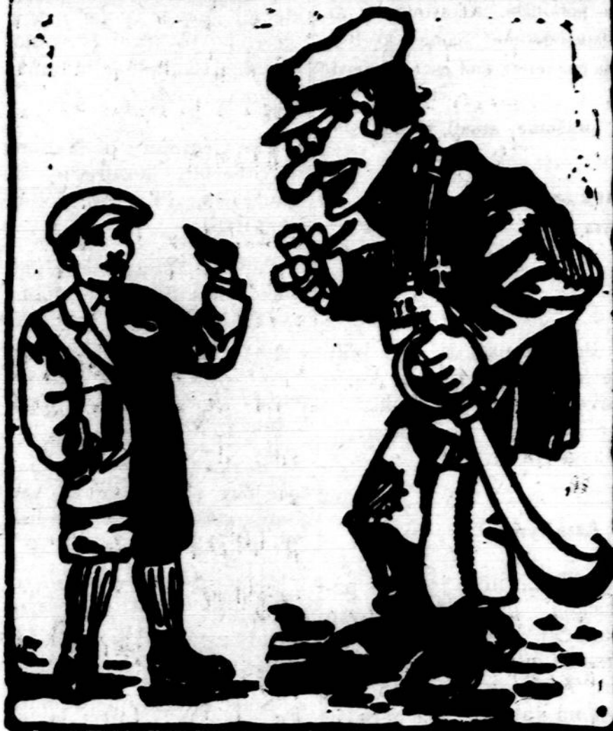
MAIKIO SU TEVU PASIKALBEJIMUS VEDA STASYS MICHELSONAS