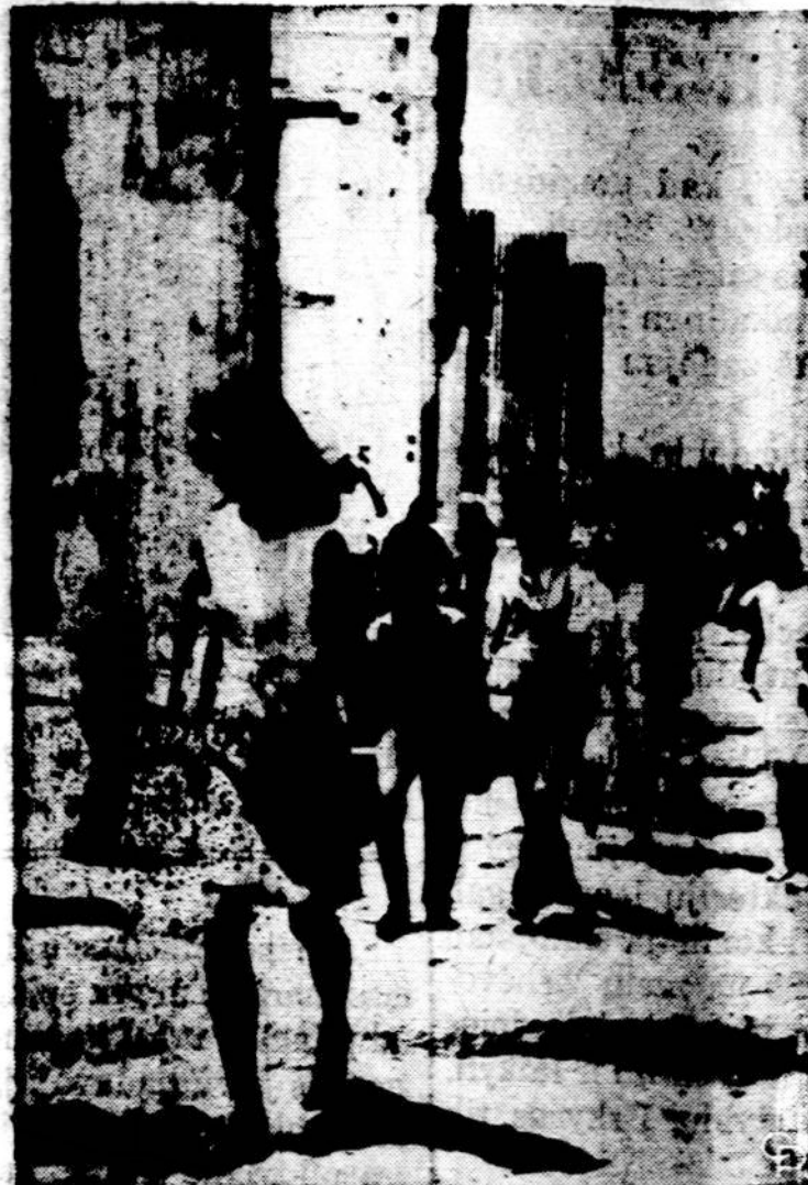
Jacquette Onassis (buvusi Kennedienė) vaikštinėja Atėnų Akropolis, Graikijoje. Paryžiaus spauda praneša, kad ji jau laukiasi kūdikio — Onassio milijonų paveldėtoje. Reikia tas 60 m. graikas dar nepersenas!

Rodosa, išvaizdava, kaip sveika ir apvaliai graži rausvakrauostė matrona sėdi prie didelio stalo, apsupto puošniais riebių vaikučių, ir baltu samčiu pilsto sriubę iš platinos dubens — pirmiausia įsėdama gretimai sėdintiems laimingam vyrui, o paskui — visiems mažuliams. Dar susigandžiau paklausti ir iš kitos pusės: — Lėg šitai tamata, gyvenama sostinėje, turbūt, ge-