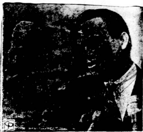
Kalba gubernatorius George Wallace, kai jis dar nebuvo piktadarijo pašautas gegužės 15 d. Laurel mieste, Md. Ar jis galės kandidatuoti į prezidentus, priklausys nuo jo sveikatos stovio. Dabar dar neišku, ar jis begalės vaikščioti, nes kulka pažeidė nugar-kaulio nervą.

Ilgametis Taiwano prezidentas Chiang Kai-shekas jau penktą kartą perrenkamas. Dabar jis prisaikdintas dar šešeriems metams.