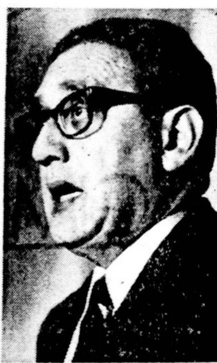
Henry Kissingeris, svarbiausias prezidento patarėjas užsienio politikos reikalais, kuriam pavedami atlikti labai svarbūs ir slapti uždaviniai. Jis paruošė prez. Nixono kelionę į Kiniją ir į Sovietų Sąjungą. Sakoma, kad prezidentas jį pasirinko dėl to, kad jis fiziškai labai ištvėrimingas, labai išsimokslinęs, moka santykiuoti su visokių pažiūrų žmonėmis ir gali daug geriau negu kiti diplomatai laikyti už dantų liežuvi ten, kur reikia. Gromyko ir kiti pareigūnai,

Gegužės 26 d. prezidentas ruošia balių Amerikos ambasadoje, gegužės 27 lankysis Leningrade, 29 d. išvyks iš Maskvos į Kijevą, gegužės 30 d. viesės Teherane, o 31 d. išskris į Lenkiją, iš kurios birželio 1 d. išvyks namo.