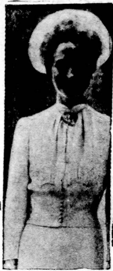
Windsoro kunigaikštienė, gegužės 28 d. Paryžiuje mirusio buvusio Anglijos karaliaus Eduardo VIII žmona. Ji yra amerikietė, du kartu persiskyrusi. Dėl jos Eduardas VIII atsiskakė sosto ir ją vedė. Nuotrauka daryta prieš 10 metų. Dabar ji yra 75 m. amžiaus.

per 30 minučių išskrenda iš Carlbado oų ir neįvyksta nė vieno susidūrimo.