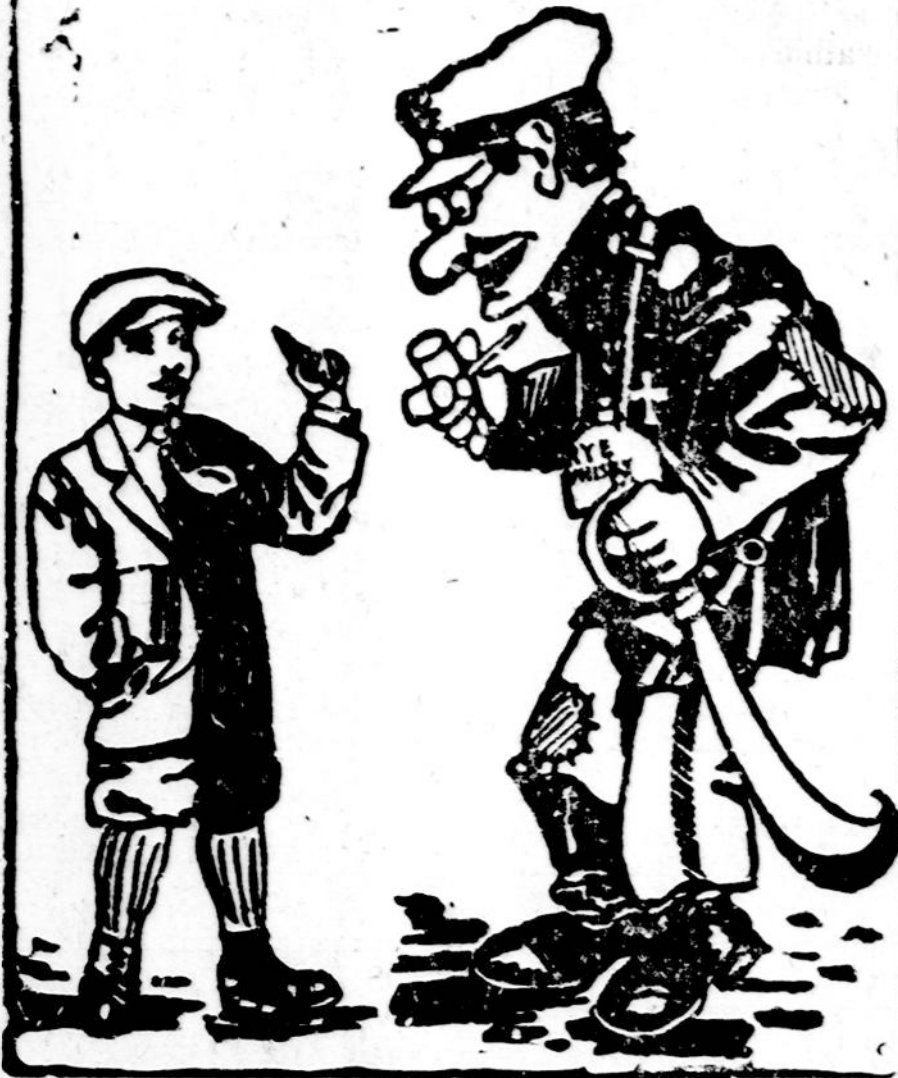
MAIKIO SU TĖVU PASIKALBEJIMUS VEDA STASYS MICHELSONAS