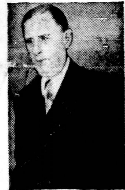
Gen. de Gaulle, buvęs Prancūzijos prezidentas, kuriam birželio 18 d. atidengtas paminklas Colombey Les-Deux Eglises miestyje, kuriame jis gyveno ir mirė. Iškilimėse dalyvavo generolo našlė, prezidentas Pompidou ir 30.000 prancūzų. Prezidentas savo kalboje tarp kitko pasakė: "Mirtis yra tik pradžia, tavo legenda, generole, tik prasidėjo ir augs diena iš dienos".