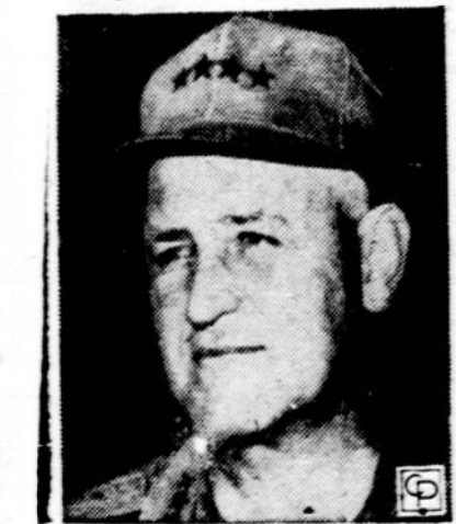
Dabartinis JAV-bių karo vadas Vietname gen. Creighton Abrams paskirtas Jungtinio generolinio štabo kariuomenės viršininku vieton išėinančio į pensiją gen. Westmoreland.

Iš New Yorko į St. Louis skridusio lėktuvo oro piratas pareikalavo $502,000, parašiuo ir dar išmokyti juo nusileisti. Kai visa tai buvo įvykdyta, jis nusileido žemėn Indianos valstijoje ir kol kas dar nesurastas.