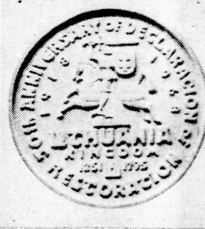
Medalis nuotrauka padidinto mastelio

Medalį kaldino Franklin Mint kalykla. Ji kaldino ir Trijų Prezidentų medalį 1968 m.