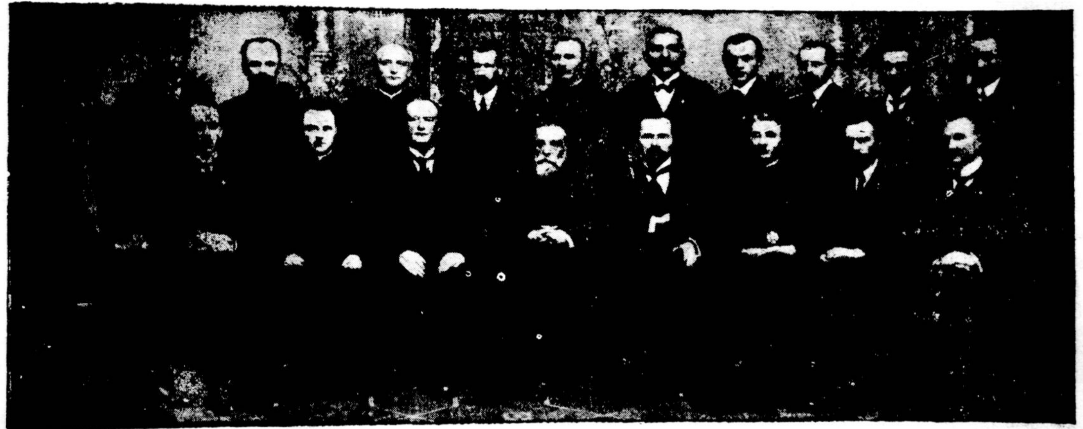
Lietuvos Taryba, kuri 1918 m. vasario 16 d. Vilniuje paskelbė atstatanti nepriklausomą, demokratiniais pamatais sutvarkytą Lietuvos valstybę su sostine Vilniuje. Iš kairės į dešinę sėdi: Jonas Vileišis, Jurgis Šaulys, kun. Justinas Staugaitis, Stanislovas Narutavičius, dr. Jonas Basanavičius, Antanas Smetona, kun. Kazimieras Šaulys, Steponas Kairys, Jonas Smilgevičius. Stovi: Kazys Bizauskas, Jonas Vailoškaitis, Donatas Malinauskas, kun. Viadas Mironas, Mykolas Biržiška, kun. Alfonsas Petrusis, Salemonas Banaitis, Petras Klimas, Aleksandras Stulginskis, Jokūbas Šernas ir Pranas Dovydaitis. Šiandien iš jų nebėra nė vieno gyvo. Paskutinis mirė A. Stulginskis 1969 m. rugsėjo 24 d.