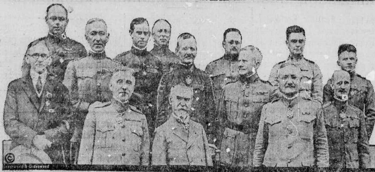
Suvienytų Valstijų generolai Francuzijos ambasadoje Washington, kur Francuzijos ambasadorius, vardu savo valdžios pasveikino, kaipo Francuzijos garbės legijonos narius

Daug dirbtuvių jau susitaukė, bet nekuriuos dar vis streikuoja, nenori priimti unijos; iš pastarųjų viena Brooklyne, kur dirba didžiūmoje lietuvių ir paliokės, dirbdavo ilgas valandas ir už mažą užmokestį, beveik sutiktu ant reikalavimų, tik jokių būdu nenori pripažinti unijos, o darbininkai be uni-