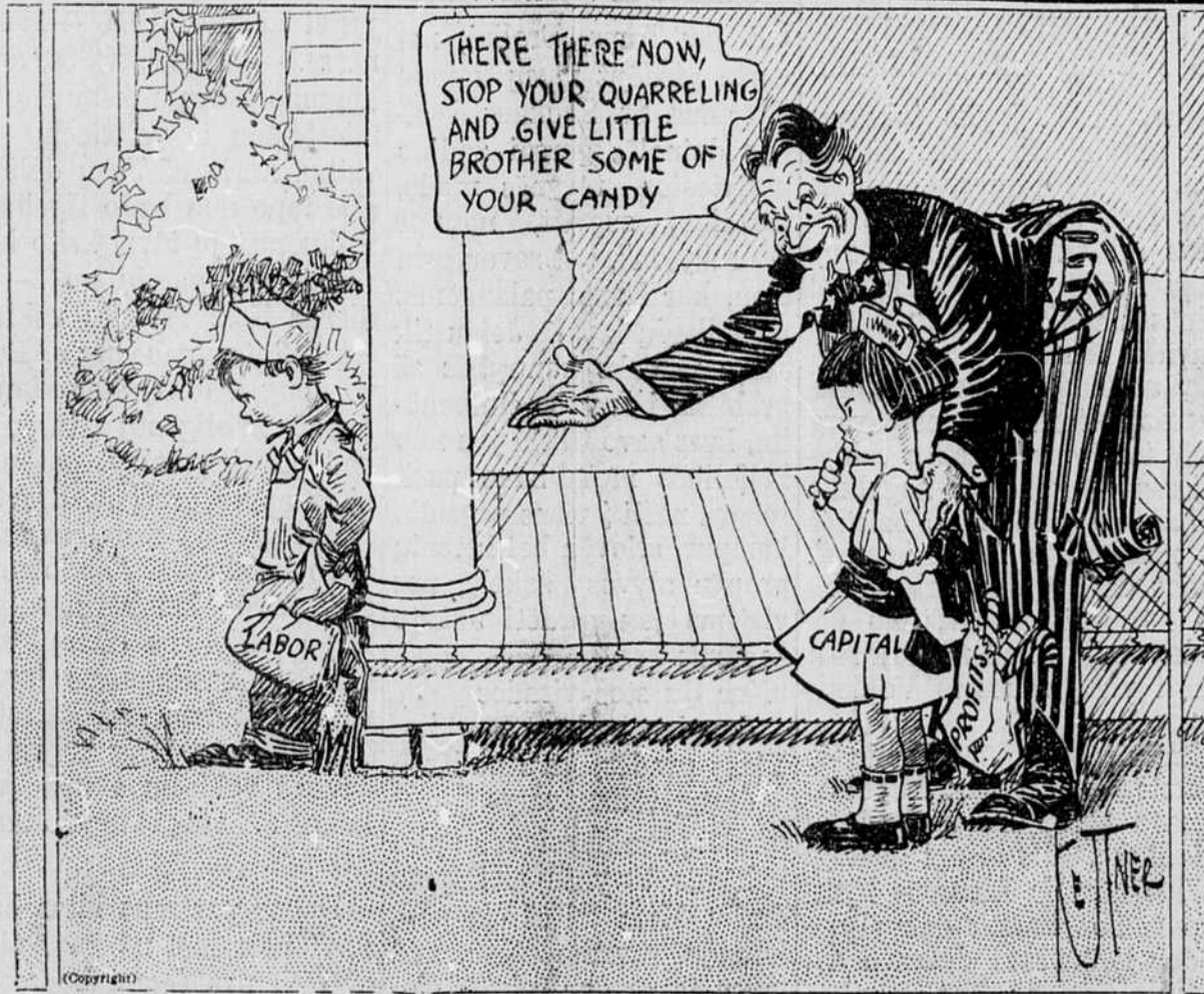
Dėdė Samas nori, kad išlepintas kapitalas dalintųsi smaguriais su darbo žmonėmis.