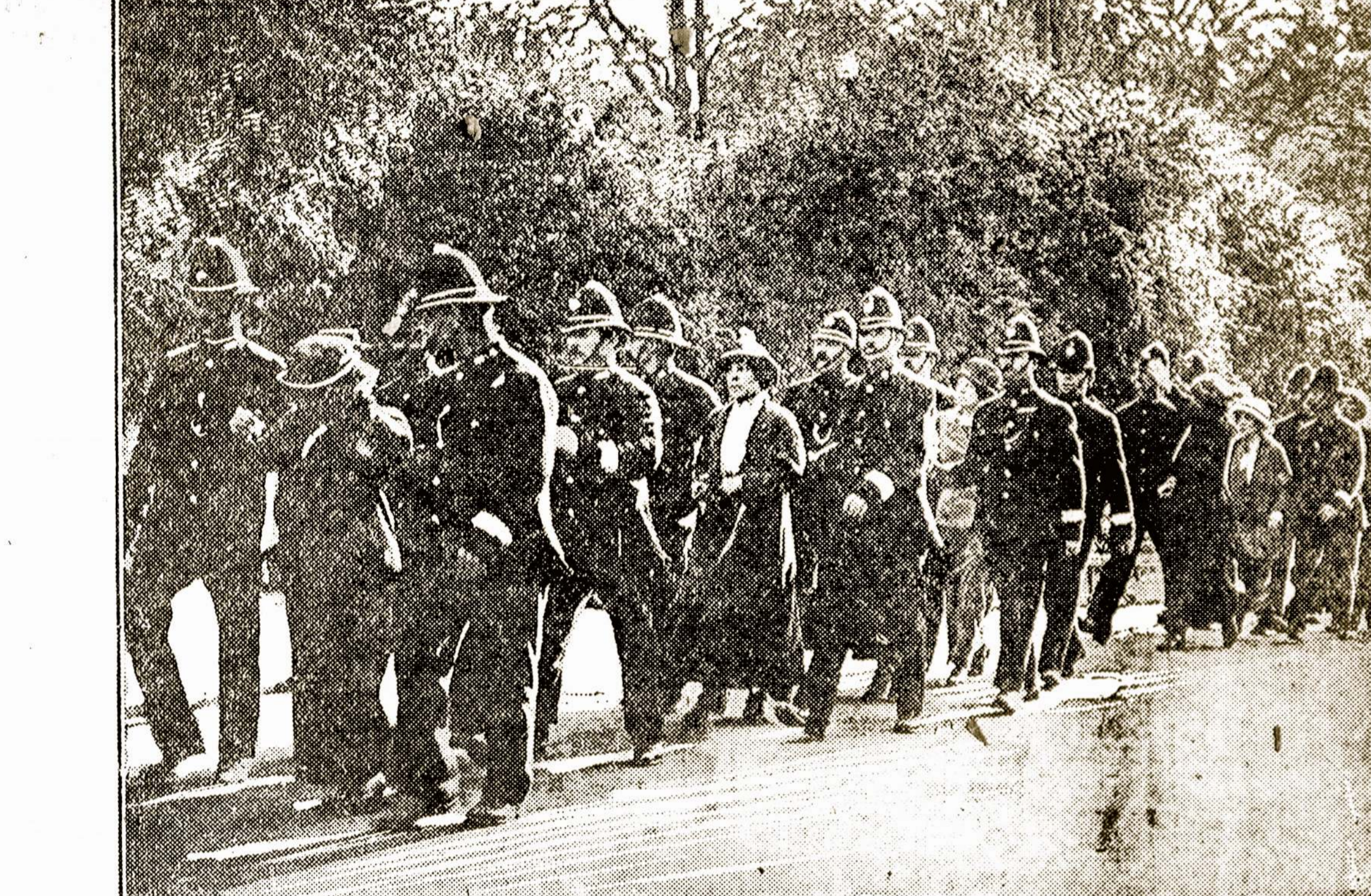
SUFFRAGETTES ARRESTED OUTSIDE BUCKINGHAM PALACE, ENGLAND.

Drugiųjų yra keletas: L. S. S. 23 kuopa, S. L. A. 18 kuopa, S. L. A. 29 kuopa ir šv. Petro draugija.