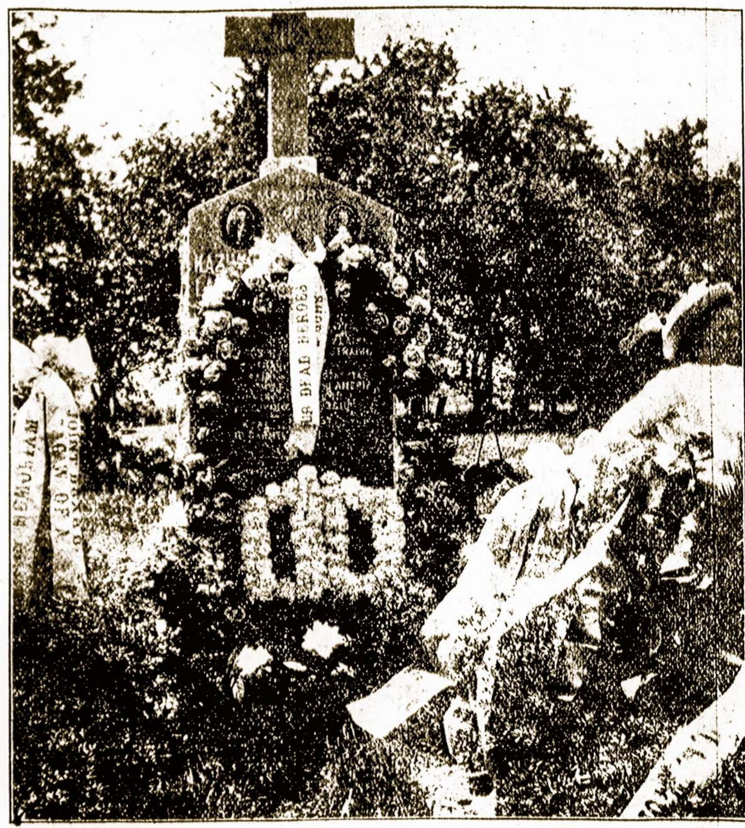
Papuostas kapas kritusių laike rubsiuvių streiko draugu: Lazinsko ir Nagreckio.