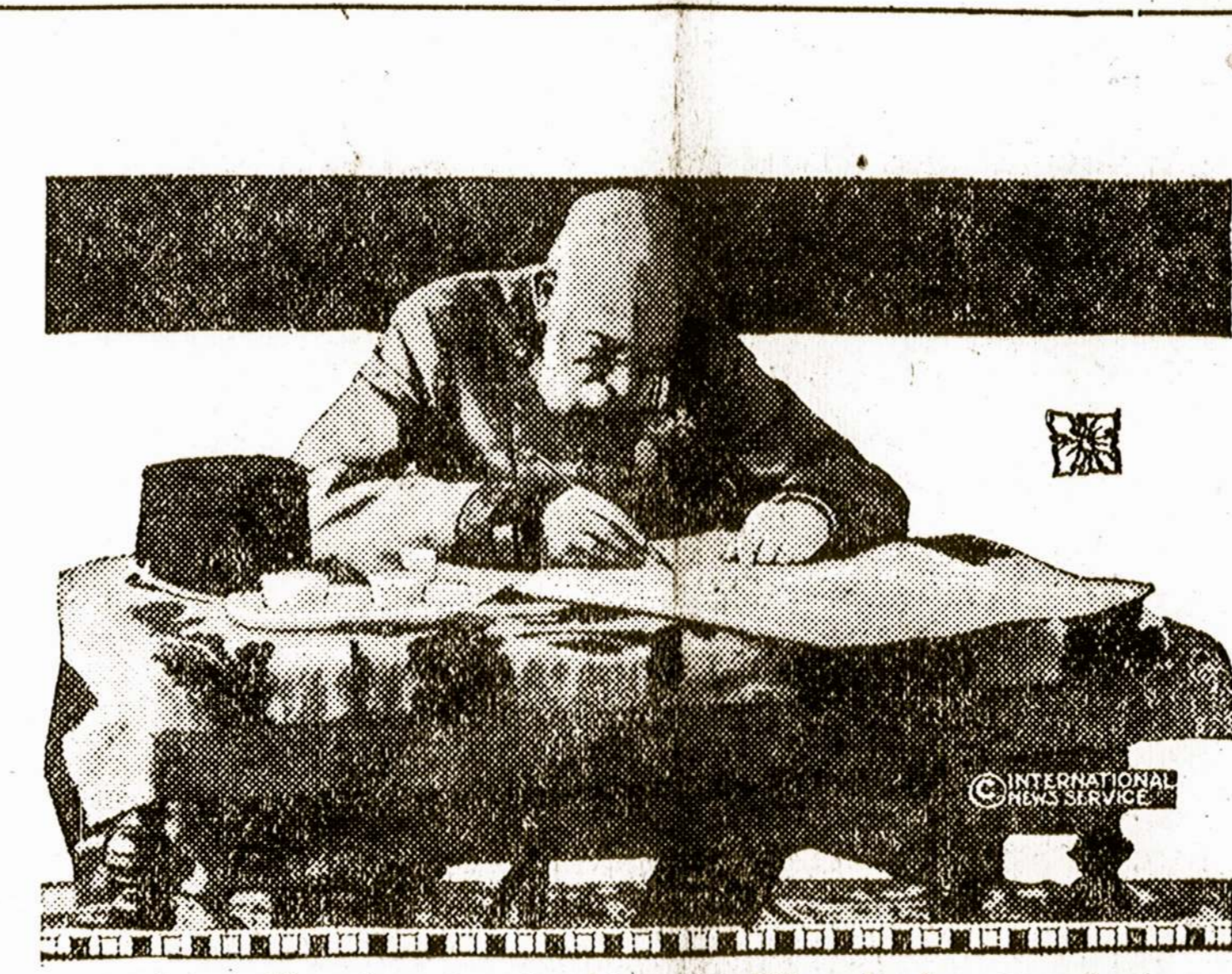
Austrijos imperatorius studijuoja karės planus.

BRUXELLES, Aug. 14. — Mušyje prie Haeleno seređoj vokiečių kritę 3000.