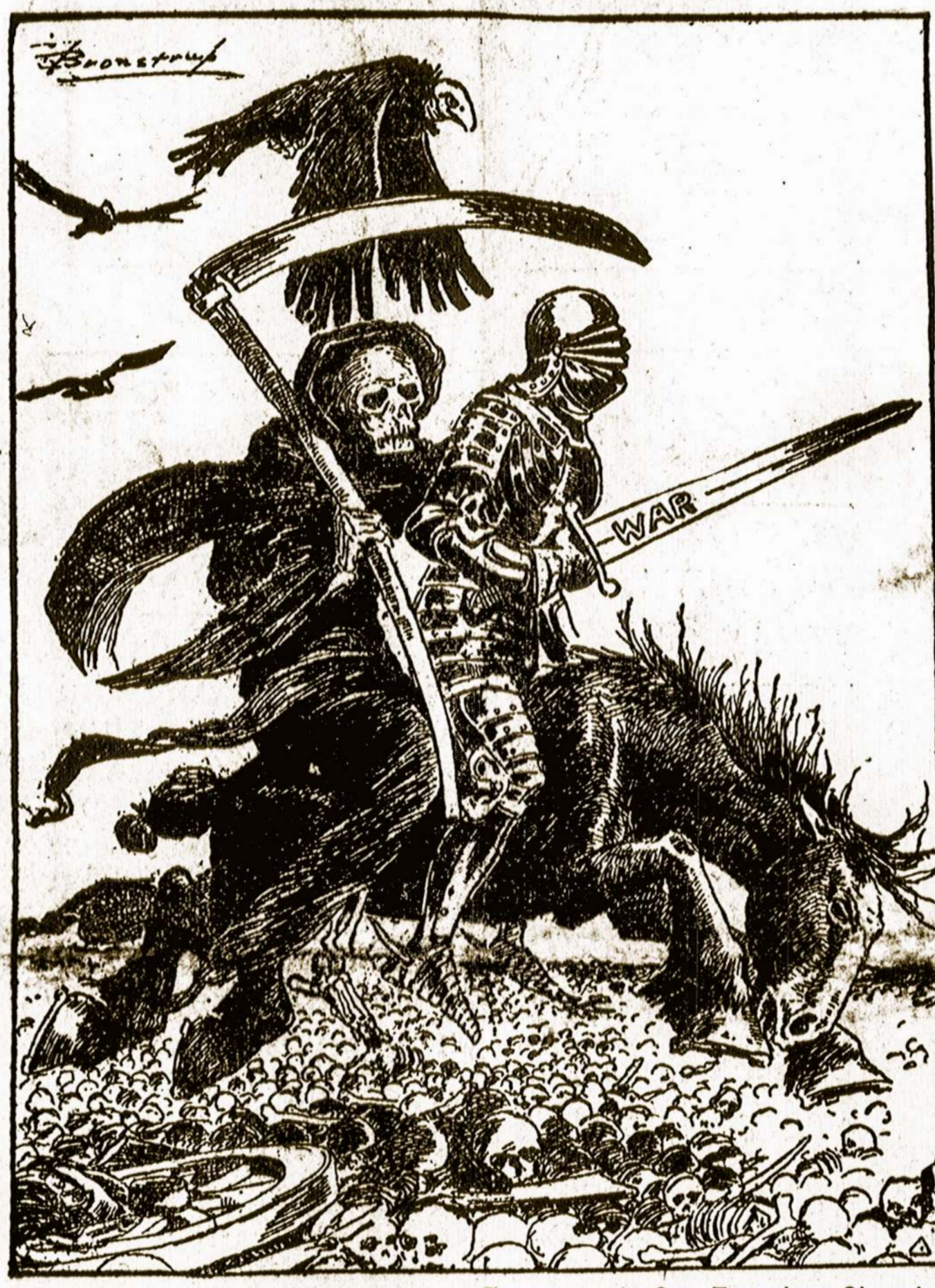
Karė, Giltinė ir Varnai.

laivis laikėsi augštai tamsoje ir jį negalima buvo pataikyti. Žmonės didžiausios baimės perimti išbėgo ant gatvių ir laukė, kad visas orlaivių laivybas atskridęs išnaikins visą miestą.