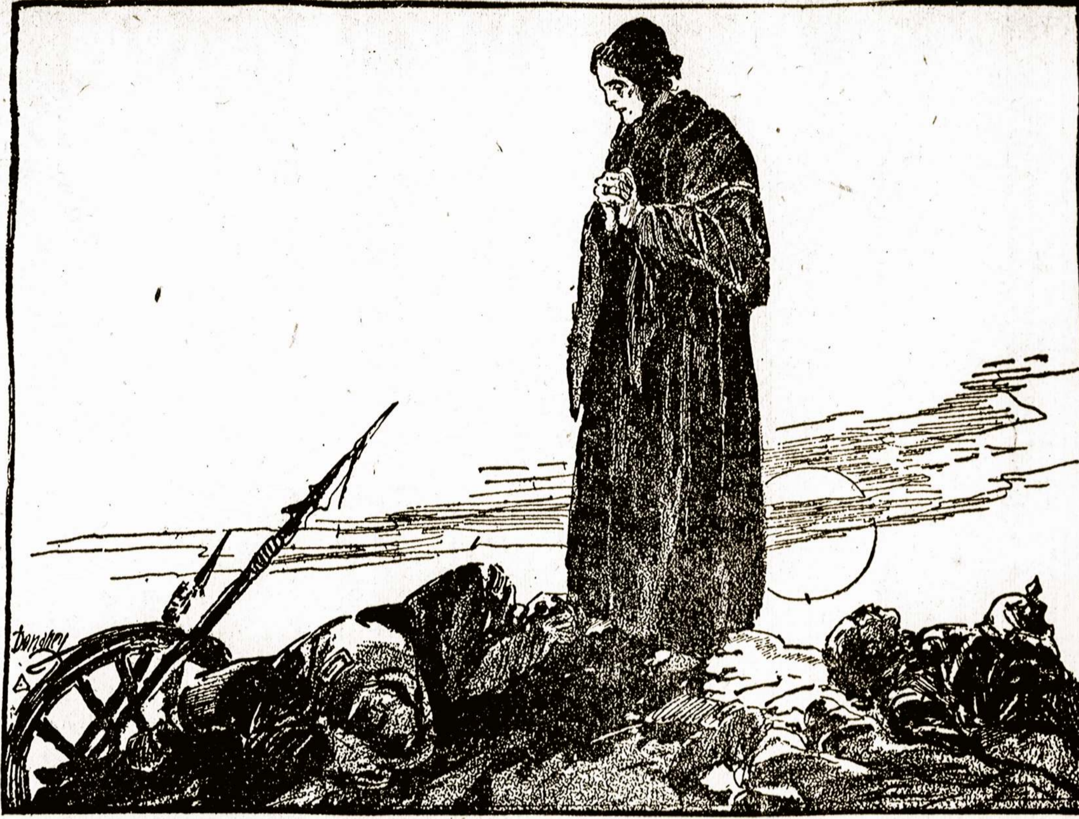
—Cleveland Plain Dealer.

K. K. Apie vakarą jau buvo rašyta. Kita žinia nesvarbi ir neįskaitoma. Reikia rašyti aiškiai ir rašalu, o ne pašėliu.