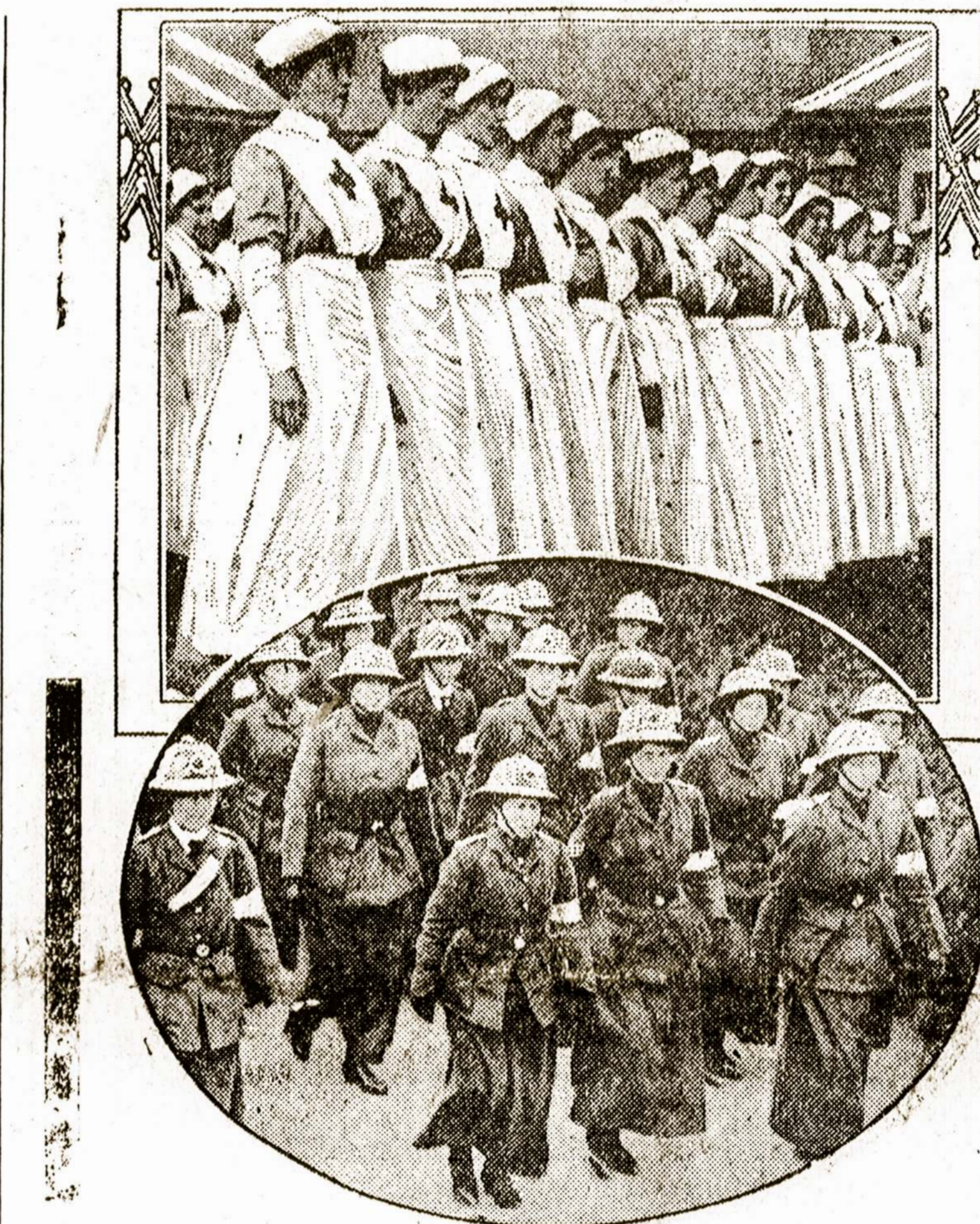
Anglų narsės, kurios dabar dirba ant Europos karės lauko.

Rusai norėjo paimti šturmu apginklią liniją nuo Przemyslilio iki Jaroslavu, bet jiems nepasisekė. Austrai laikosi ap-