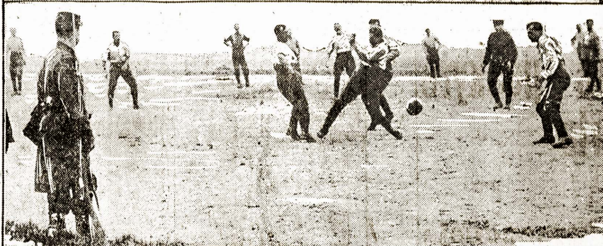
1-FRENCH REINFORCEMENTS ON WAY TO FRONT—2-ENGLISH SOLDIERS PLAYING FOOTBALL AT OSTEND, BELGIAN SOLDIER WATCHING

Viršuje: francuzų kareiviai važiuoja su amunicija prie savo pulko. Apačioje: Anglų kareiviai Ostende lošia football.