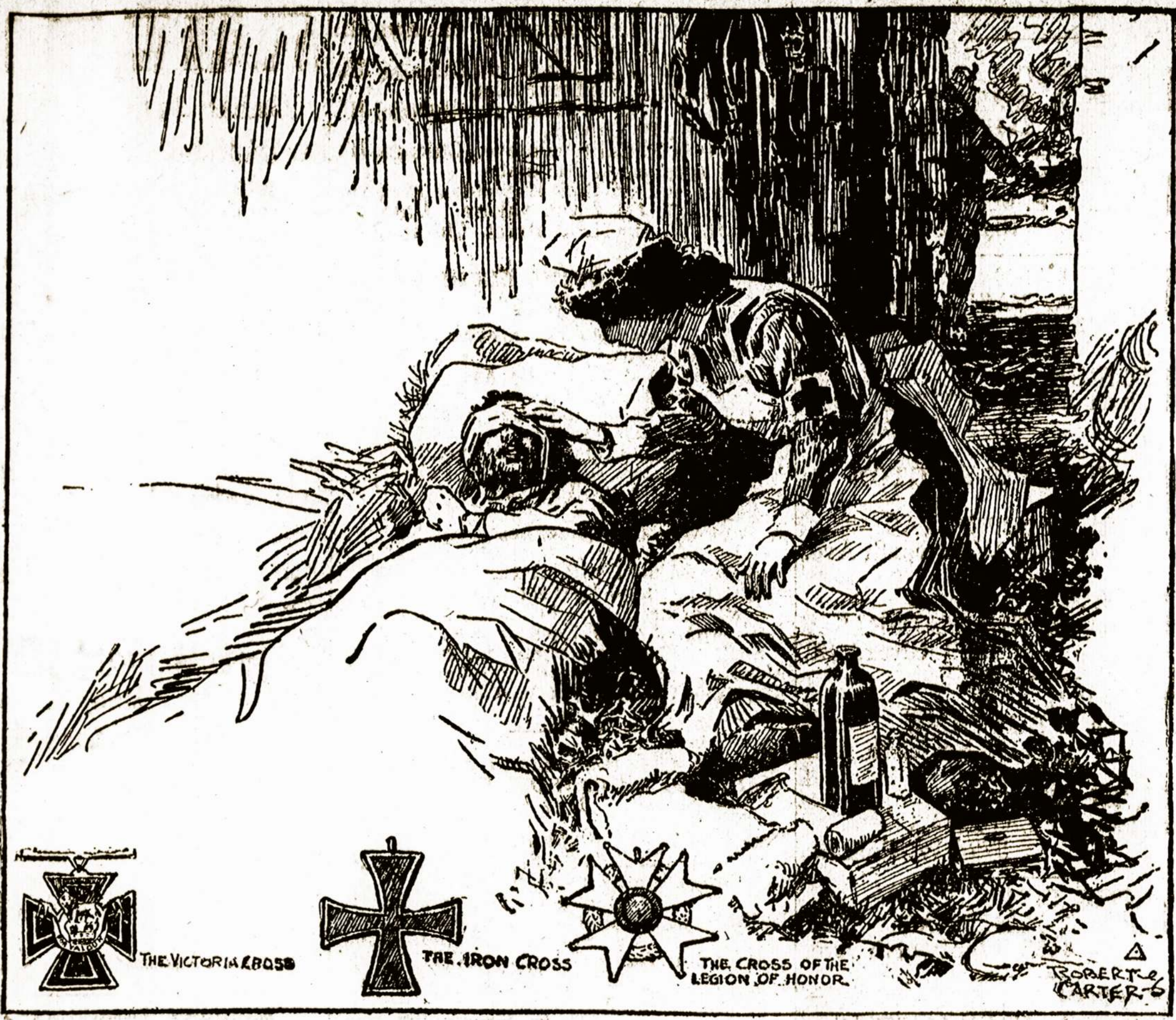
Kaip kariauja moteris.