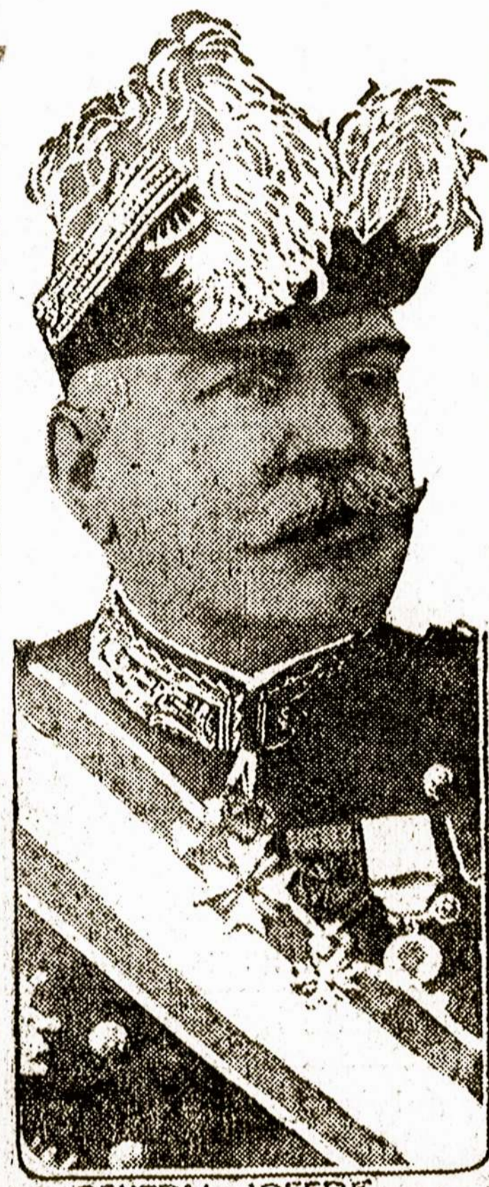
GENERAL JOFFRE Francuzų vyriausias generolas Joffre.

pastatyti sunkioji artilerija. Tikras mušis už Aisne upės dar neprasidėjo. Buvo jau užtektinai smarkių susirėmių, bet tai tik prirengiamieji žingsniai prie didžiojo mušio.