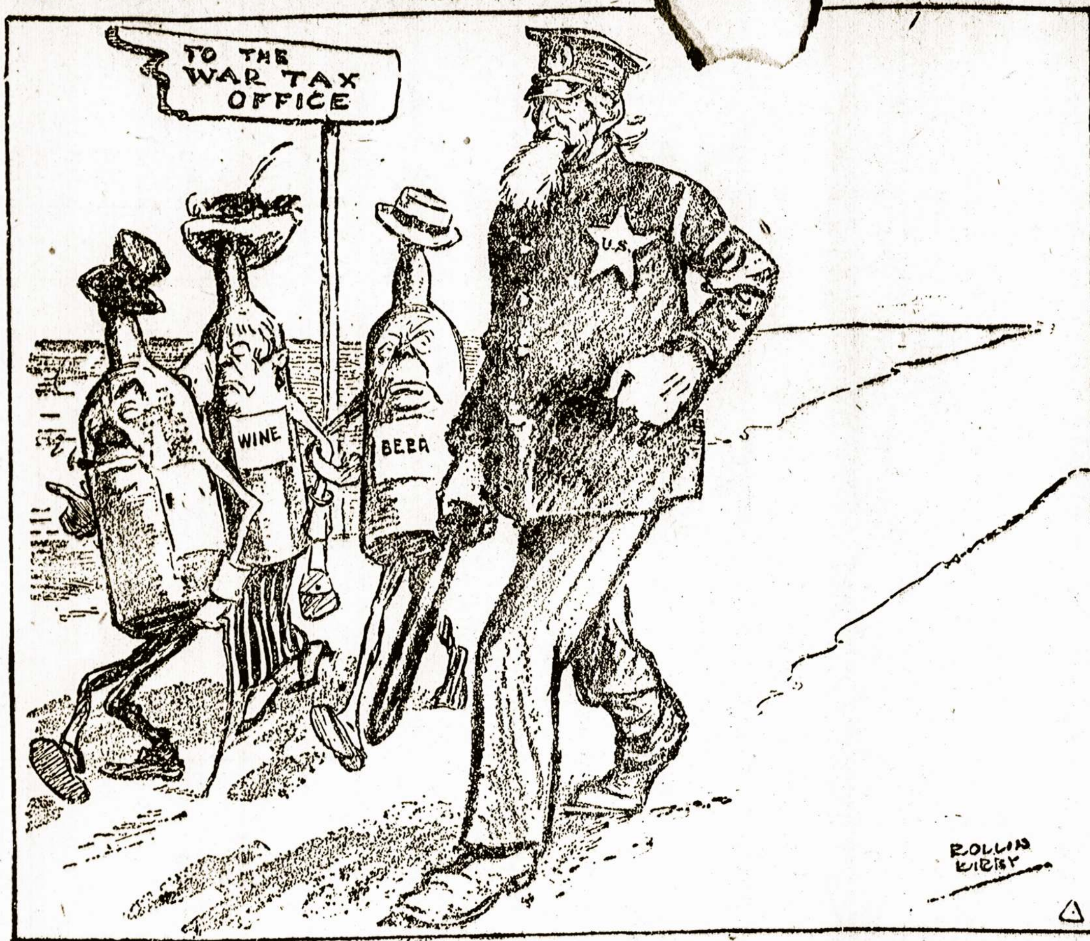
—Kirby in New York World.

*) "Toriais" Anglijoje vadinami yra valdžios šalininkai, lojalistai.