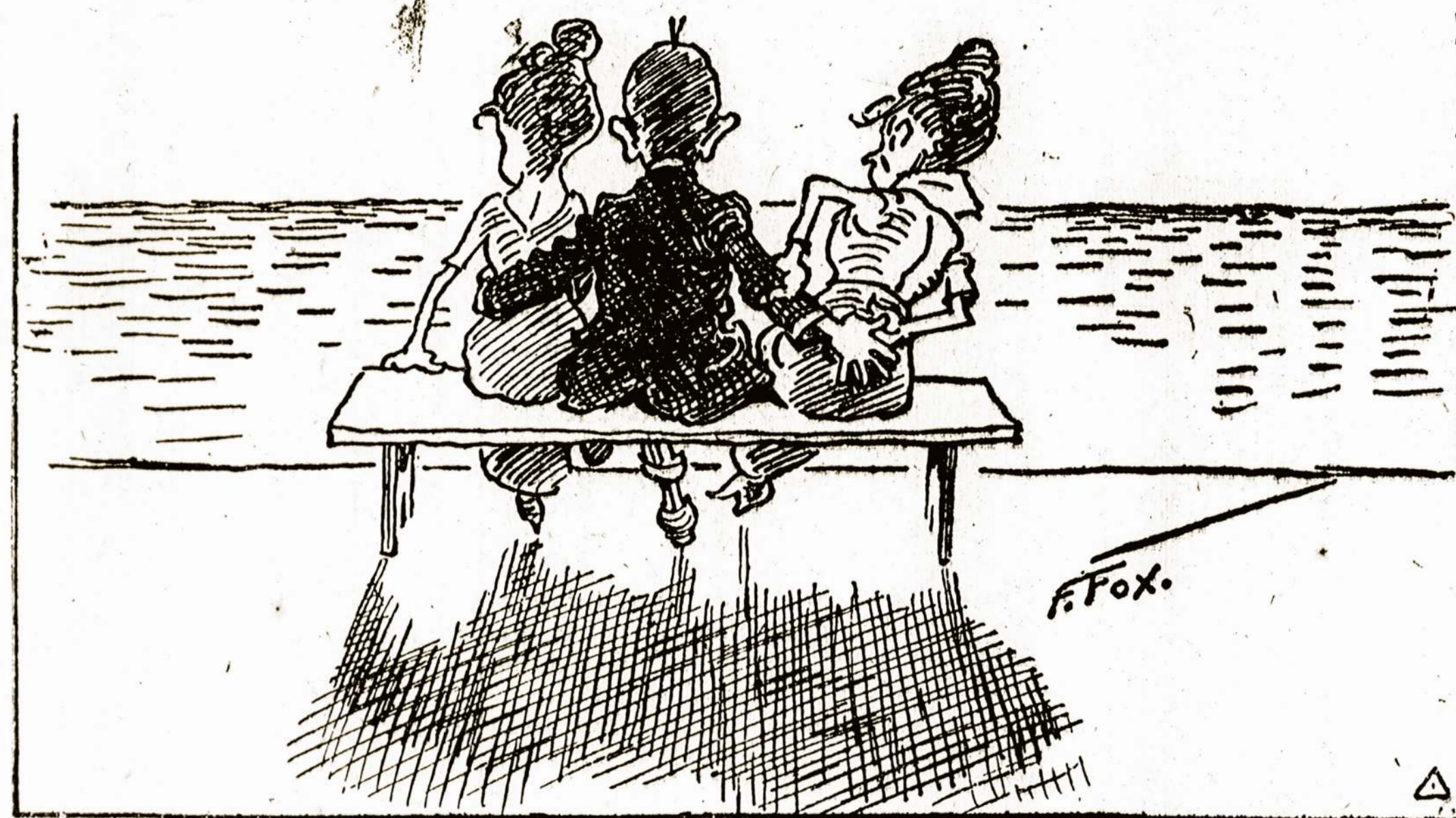
"Musų kairiojo sparno judėji mas buvo visai pasekmingas, mušti ant mūsų dešiniojo sparno." bet mes buvome smarkiai at-

"Mat, jis norėtų, kad jųjį "Drauga" kas plintytų, bet niekas neperka. Tai matote, kaip mūsų "dvasiški tėveliai" rupinasi darbininkų apšvieta. Draudžia laikraščius skaityti, draudžia juos platinti, iš kurių darbo žmonės daug ką pasimokintų."