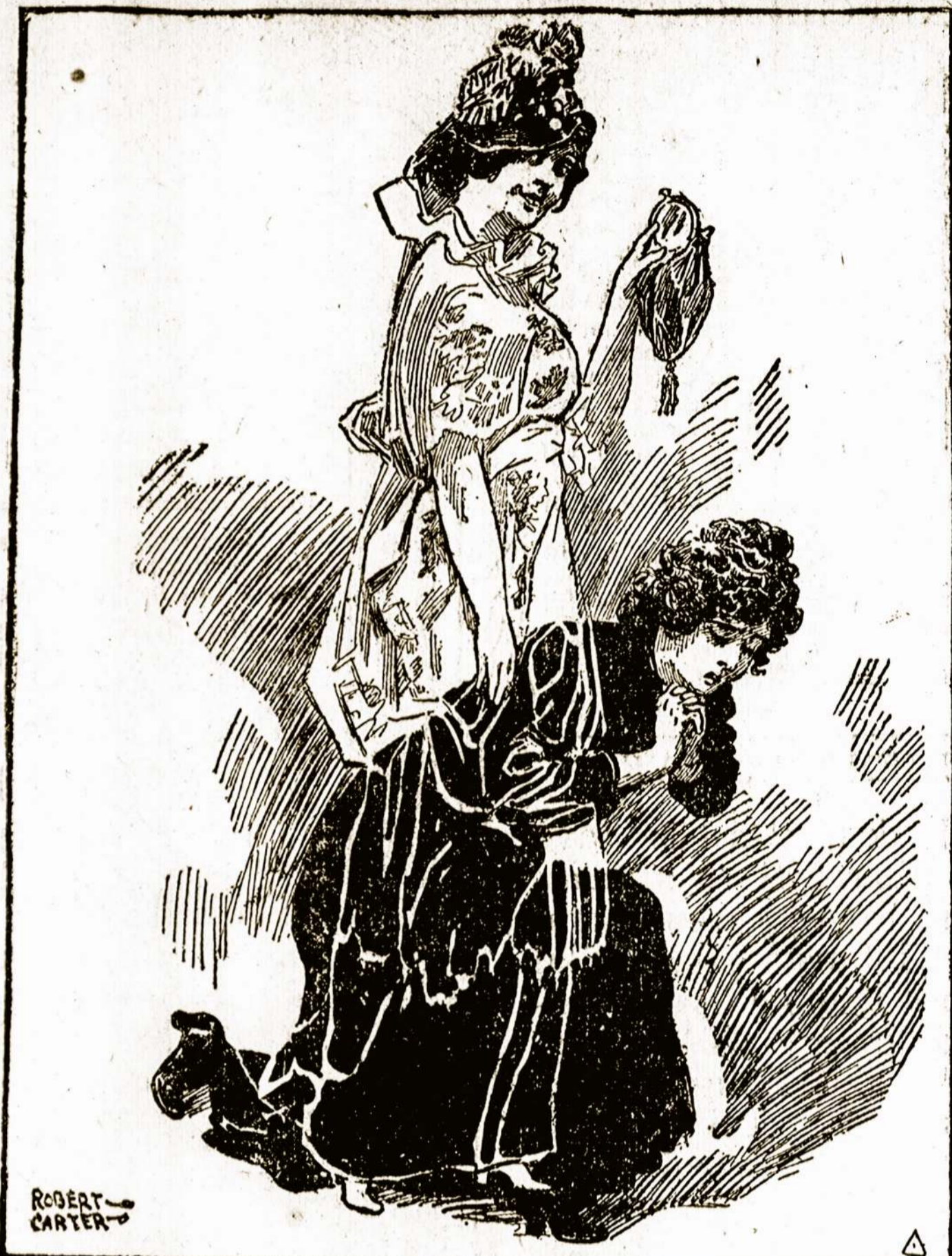
Paryžius pirmiausia ir dabar.

1) Protestuoti prieš tą spaudą, kuri nesirūpina kovoti su tokiais bankais.