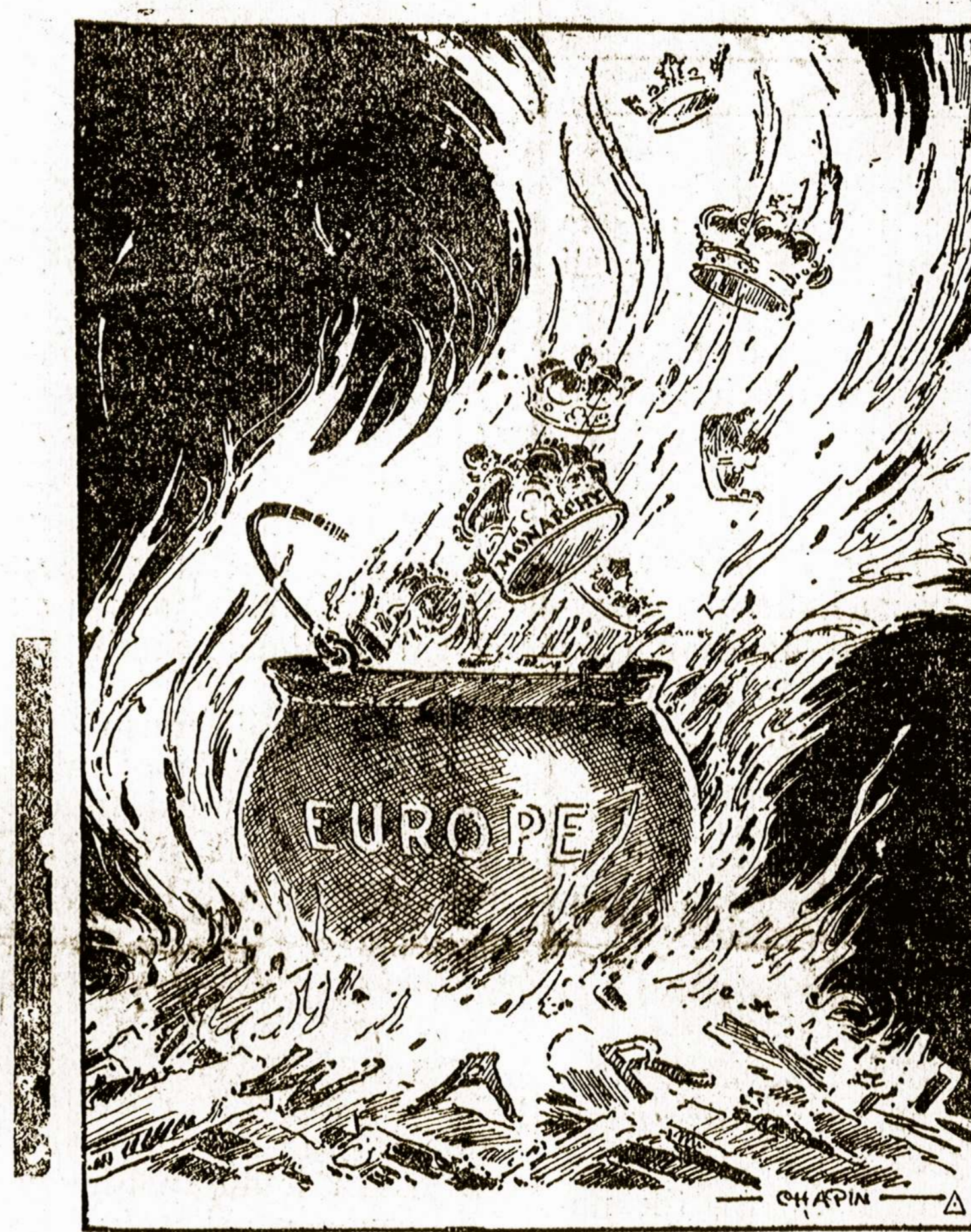
—Chapin in St. Louis Republic.

LONDONAS, Okt. 1. — Belgija vėl yra kruvinųjų scenų vieta. Vokiečiai yra pasiriję paimti Antwerpą. Jiems tas dabar yra labai svarbu, kadangi jų padėjimas Francijoje eina blogyn. Kol jie galėjo atsi- laikyti Francijoje, jie galėjo ir neimti Antverpo.