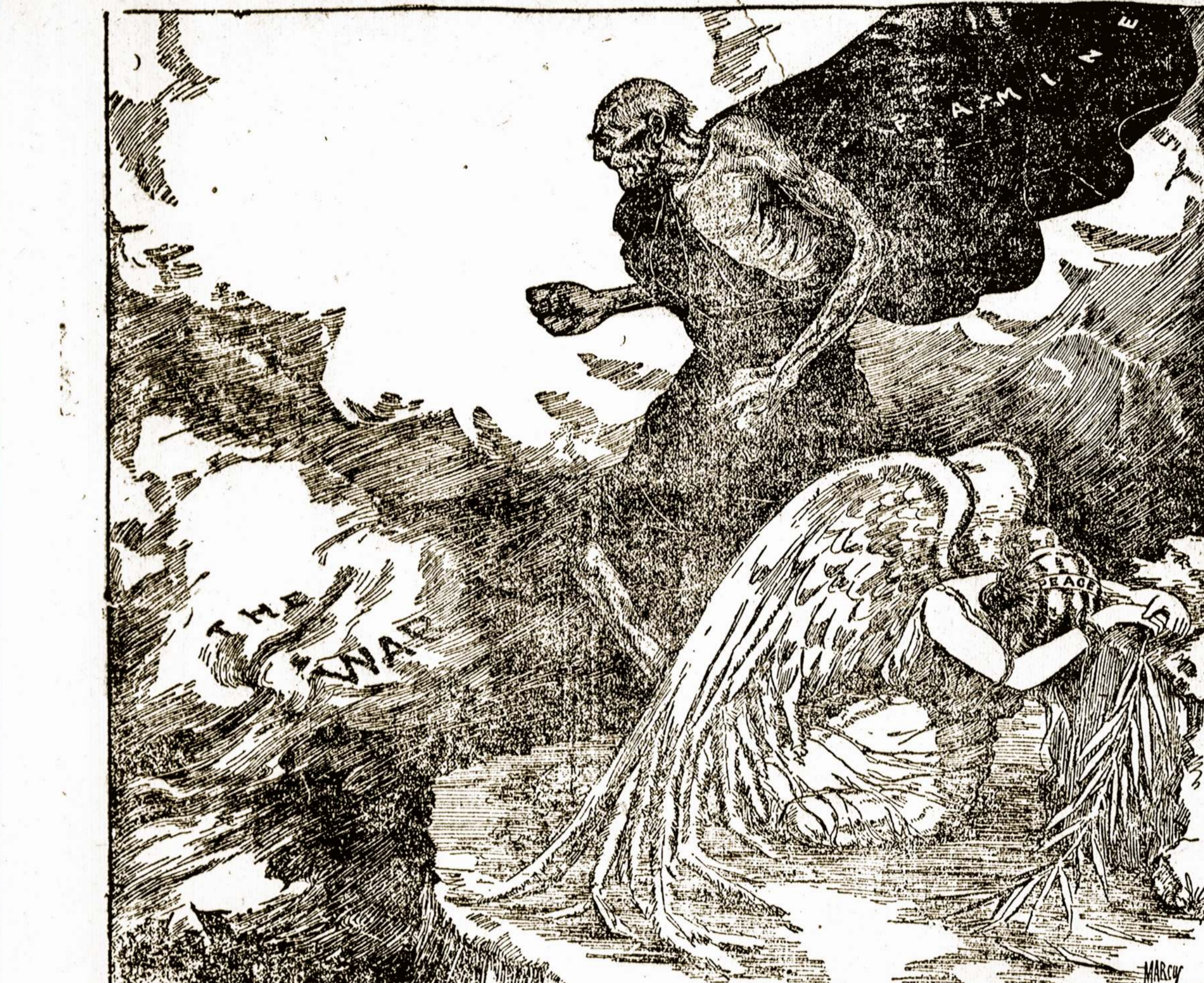
Juodos galybės, Karė ir Badas, prislėgė šviesią Taikos Dievaitę.

Seimo parodytas Amerikos lietuvių susiorganizavimo laipsnis duoda tvirtą viltį, kad Lietuvos Gelbėjimo Fondo darbas bus pasekmingas. Dar neturime smulkių žinių, kaip Seimas apibrėžė Lietuvos Gelbėjimo Fondo uždutis. Bet mums rodo, kad viena svarbiausių Fondo uždutiu turėtų būti — tampresnis visų Amerikos lietuvių suorganizavimas į vieną didelį progresivų kūną. Nes nuo tokio suorganizavimo prigulės ir Lietuvos Gelbėjimo Fondo pasisekimas ir mūsų Amerikos lietuvių reikalų aprupinimas.