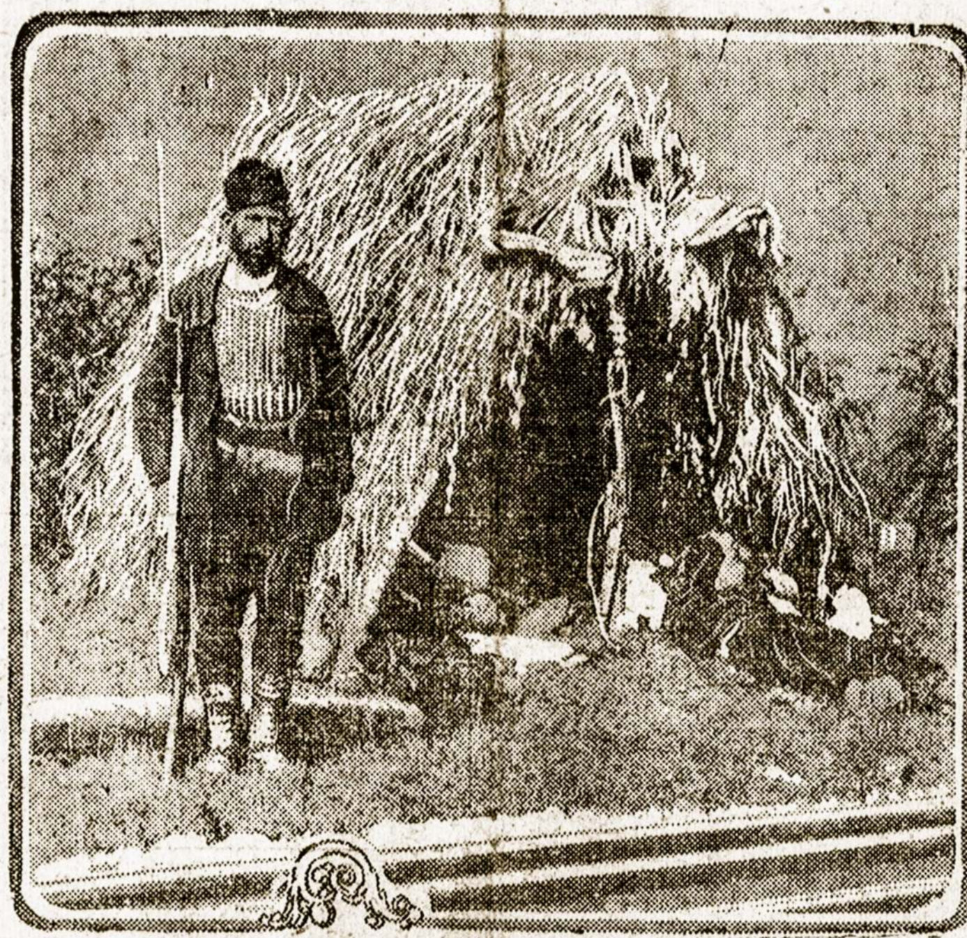
Serbų kareivis

LONDONAS, Okt. 14. — Iš Boulogne pranešama, kad vokiečių aeroplanas skraidžiojo ant to miesto ir paskui pasuko ant Anglijos linkui.