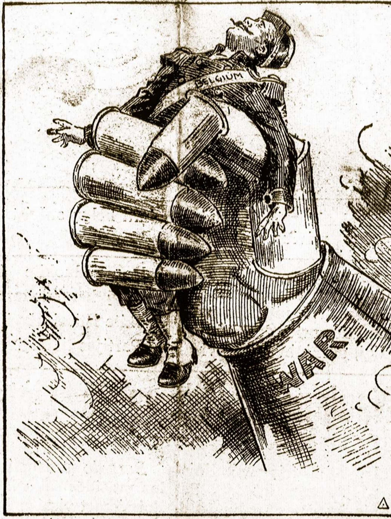
—DeMar in Philadelphia Record.

Vokietijos pranešimas sako, kad vokiečiai turėję laimėjimų ties Ypres, ir vėl užėmę