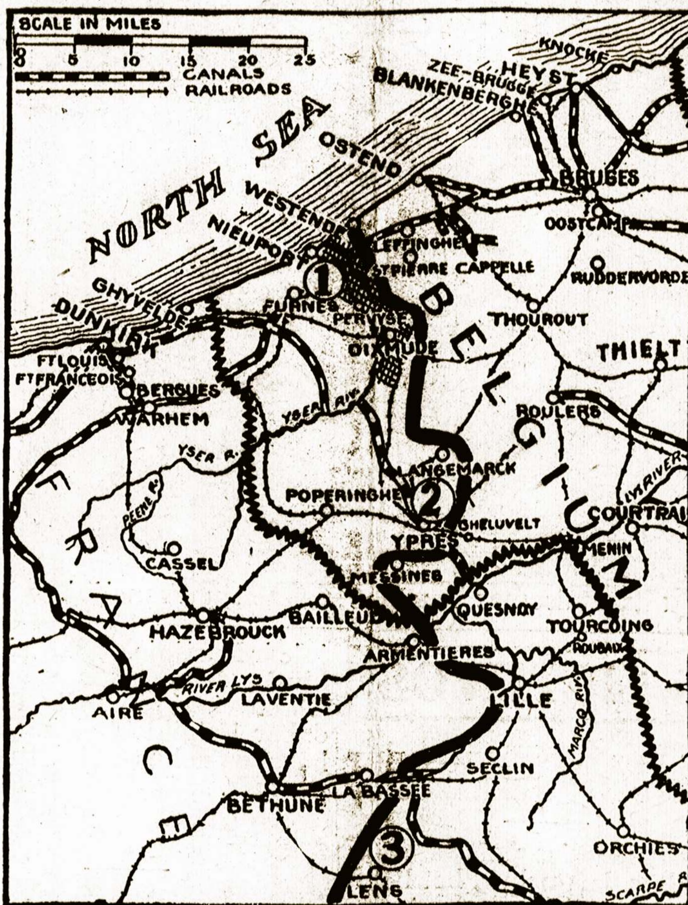
Dabartinė mušio linija Belgijoj.

PETERBURGAS, Nov. 12. — Kelių ministerija surengė traukinį su maudyklėmis armijai. 2,000 vanų galės kareiviai priimti kasdieną. Kitas traukinys yra surengtas skalbimui ir džiiovimui kareivių drabužių.