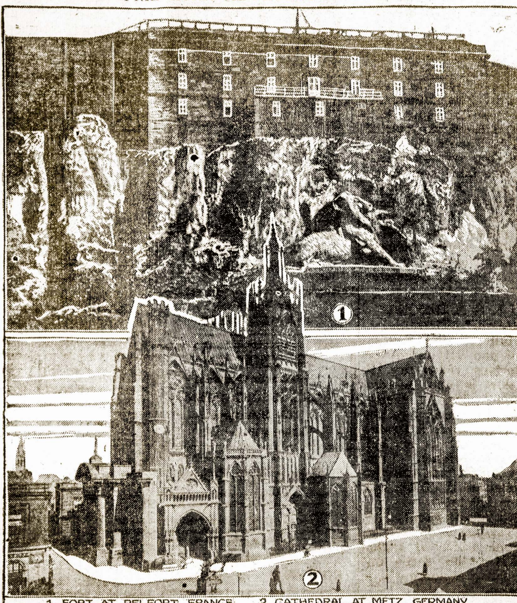
1 FORT AT BELFORT, FRANCE. 2 CATHEDRAL AT METZ, GERMANY

Viršuje: Tvirtovė Belforte, Francijoje. Apačioje: Katedros bažnyčia Metz, Vokietijoj. Kas pirmiau ateis: ar vokiečiai prie Belforto, ar Francuzai prie Metz?