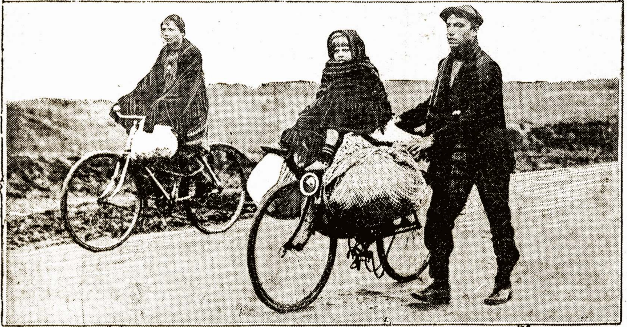
BELGIAN REFUGEES FLEEING FROM ANTWERP