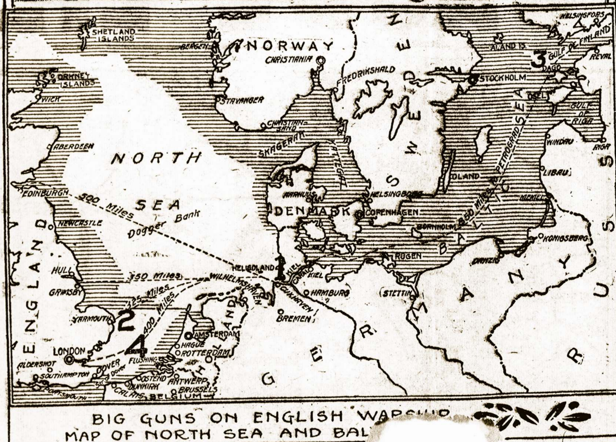
Anglijos laivų didžiosios kanuolės. Šiaurės (North) jūrų žemlapis.

neturi ko valgyti, kuo savo kūną pridengti nuo šalčio? Kalta yra dabartinė visuomenės tvarka, kuri duoda galės sutverti nesuskaitomus turtus, bet juos pveda tikta vienai daliai žmonių, o kita skaitlinė dalis žmonijos dalį pasmerkia mirtinai bėgai.