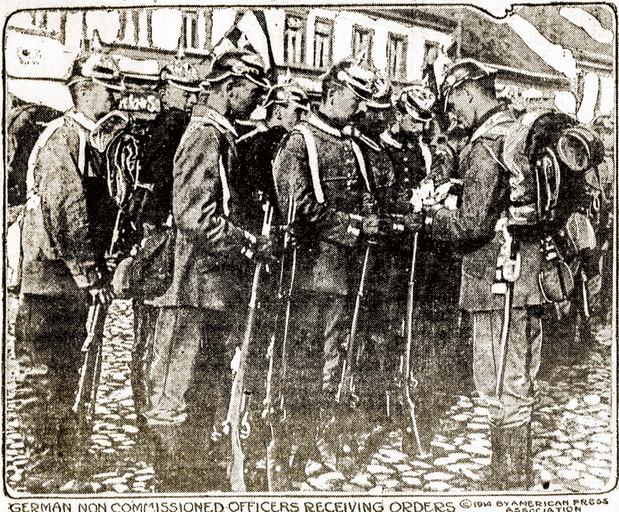
GERMAN NON COMMISSIONED OFFICERS RECEIVING ORDERS

Vaikai ir pačios nebežino nė kam bedėkoti už girtubės įstai-gų uždarymą, nes del vyro ir tėvo girtuokliavimo liuoba jie daug nukentėti, o girtuokliaujančių skaičius vis didėjo. Neatsilikdavo nė rusai kolonistai,