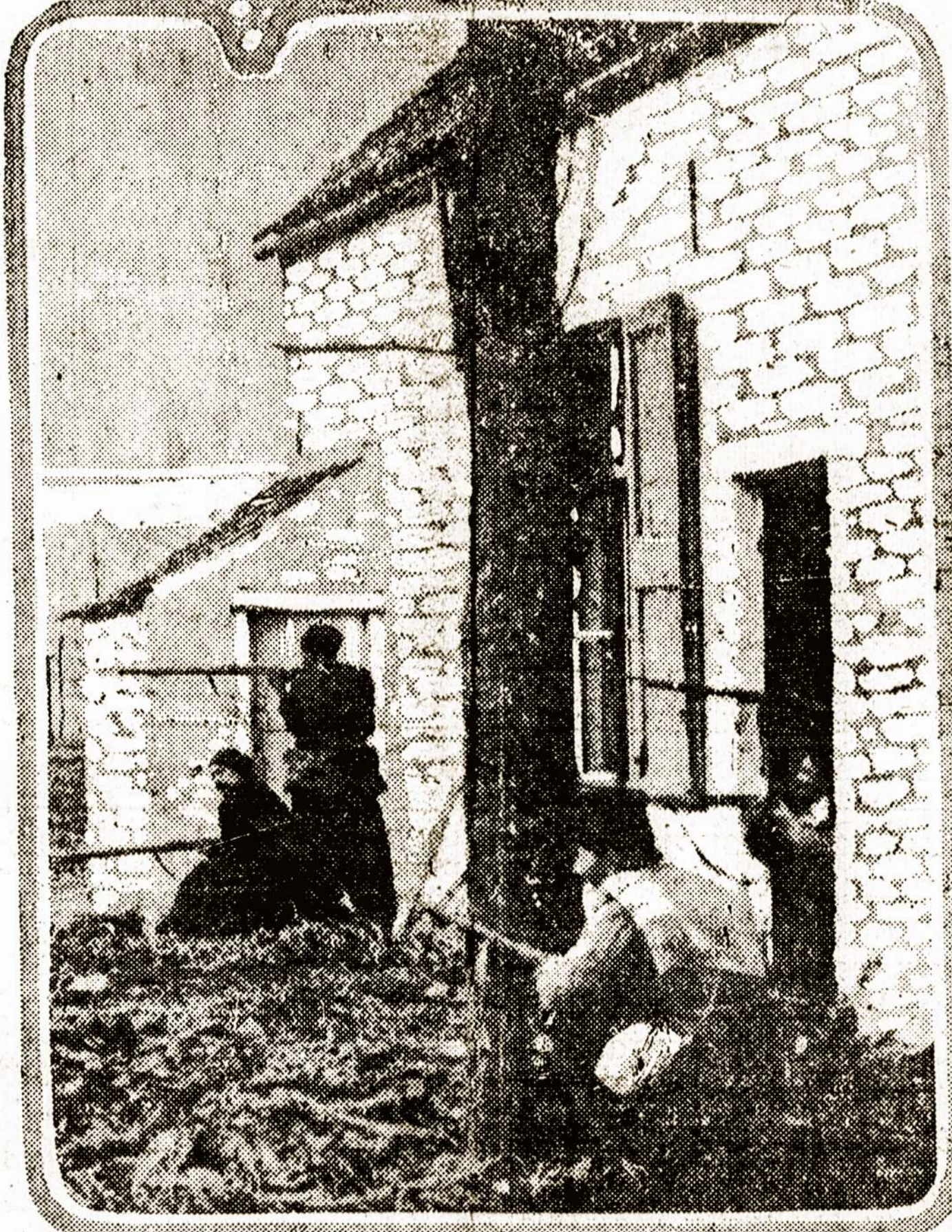
FRENCH ZOUAVES SHOOTING FROM FARM HOUSE.

Parlamento pirmininkas, atidarydamas posėdį, pasakė kalbą apie vokiečių vienybę ir