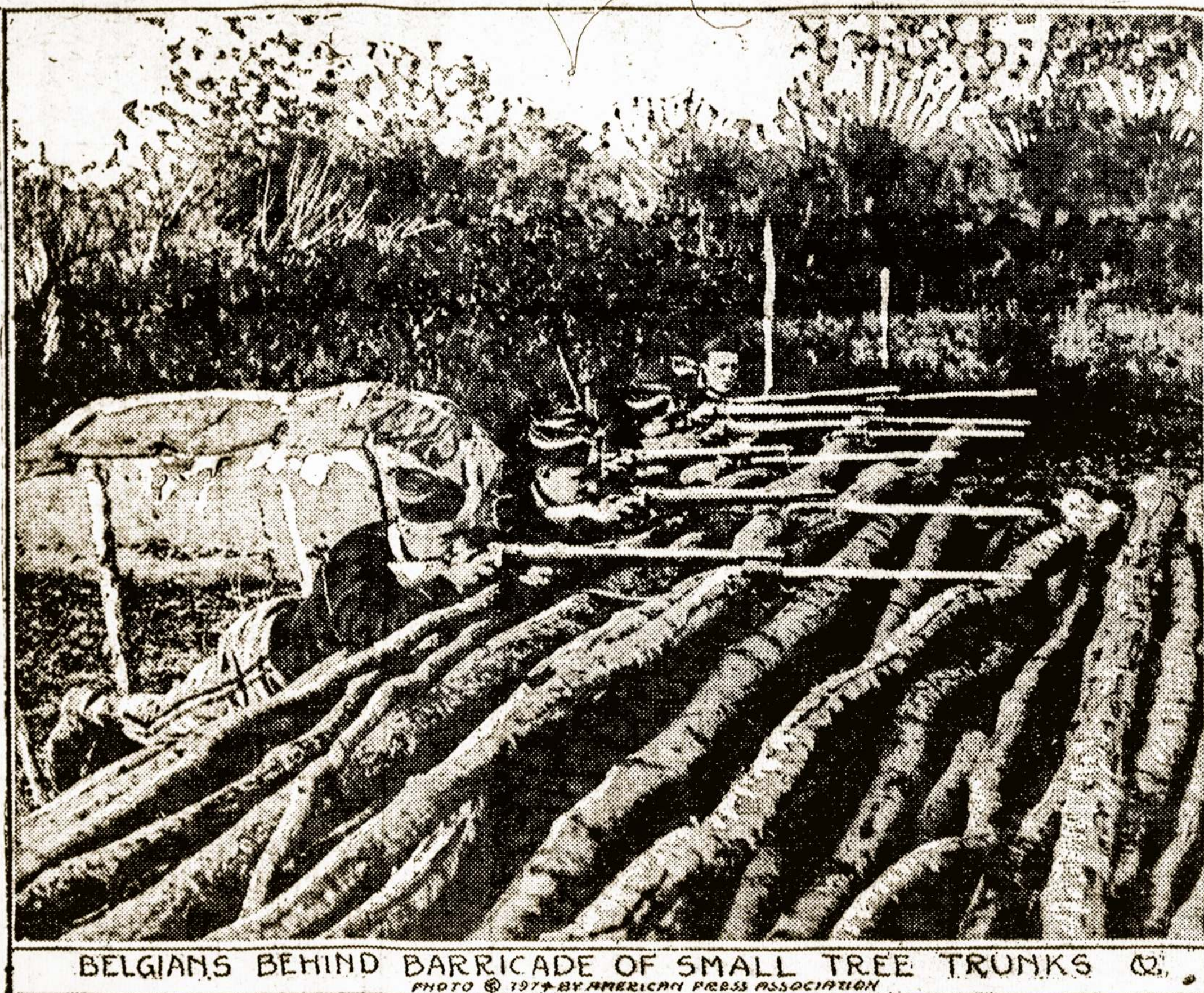
BELGIANS BEHIND BARRICADE OF SMALL TREE TRUNKS

Susipratę darbininkai visose šalyse reikalauja, kad valstybė apdraustų darbininkus nuo nedarbo, t. y. kad ji paskirtų iš savo išdo tam tikrą sumą pinigų, iš kurios bu-