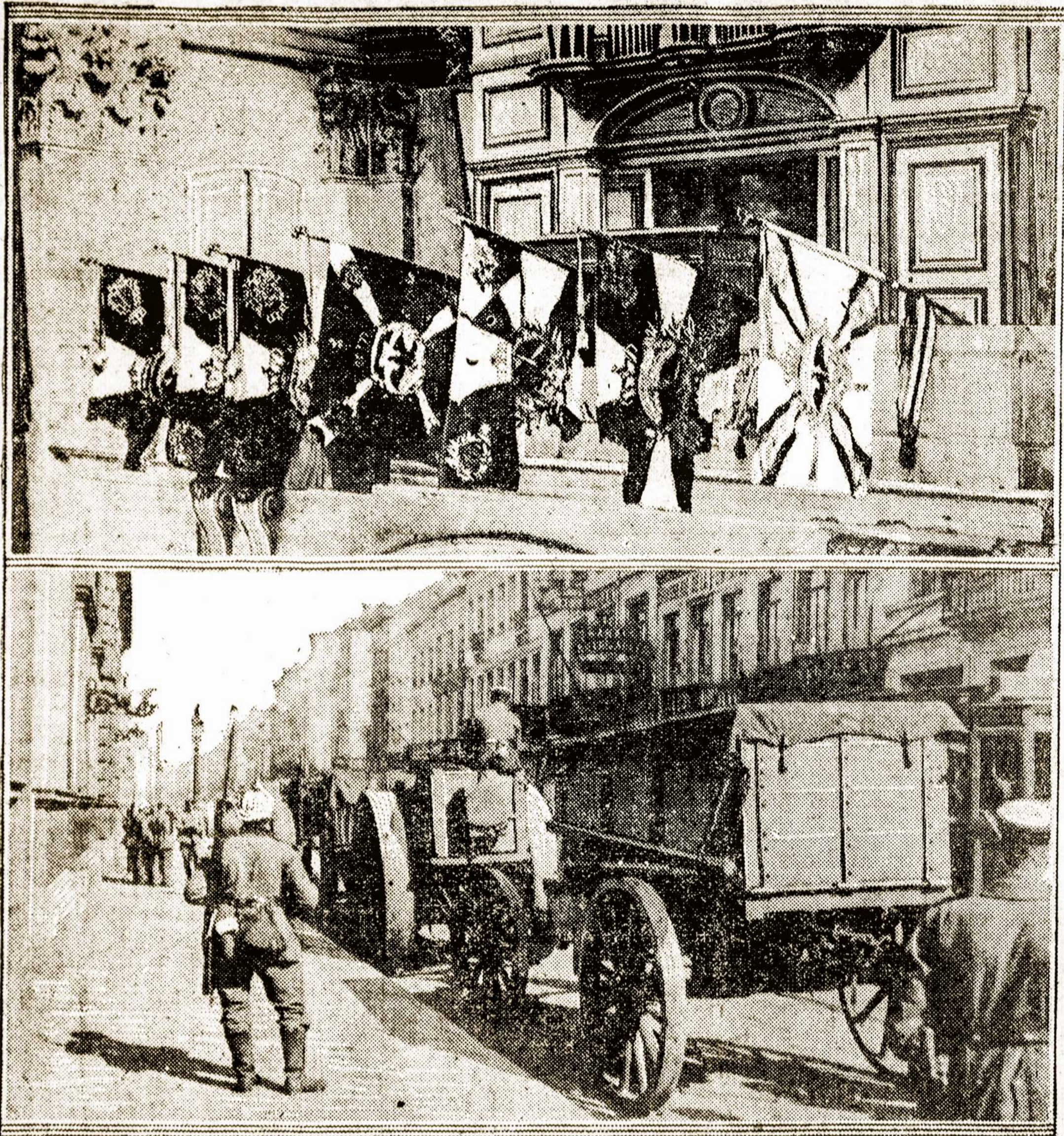
Atimtos nuo vokiečių vėlavos mūšyje prie Marnos ir išstatytos Chapelle des Invalides, Paryžiuje. Apačioj: Vokiečiai veža savo 42 centimetrų apgulimo kanuoles per Antverpą.

Mūsų skaitytojai atmena du straipsnius tilpusius "Naujienose" apie Lietuvos autonomijos reikalavimą ir neseniai šioje pat vietoje tilpusį mūsų polemiską straipsnį tame dalyke prieš "Jaunąją Lietuvą." Pamatinės mintys, kurias mes tenai išreikėme, buvo tokios: 1) Šio momento Lietuvos politikos klausimą anaipol negalima indentifikuoti (tolyginti) su autonomijos klausimu. Autonomija yra tiklata viena tu formų, kurioje gali išsilieti netolimoji Lietuvos ateitis. 2) Niekas neprirodė, kad ši forma, o ne kokia kita bus tinkamiausia Lietuvai tose sąlygose, kurias tveria ir sutvers dabartinė Europos karė. 3) Nuspręsti, ko Lietuvai patogiauusia prieliks dabar reikalauti, gali tiklata patį Lietuvos žmonės, o mūsų uždavinys tėra, patyris tuokių jų reikalavimus,