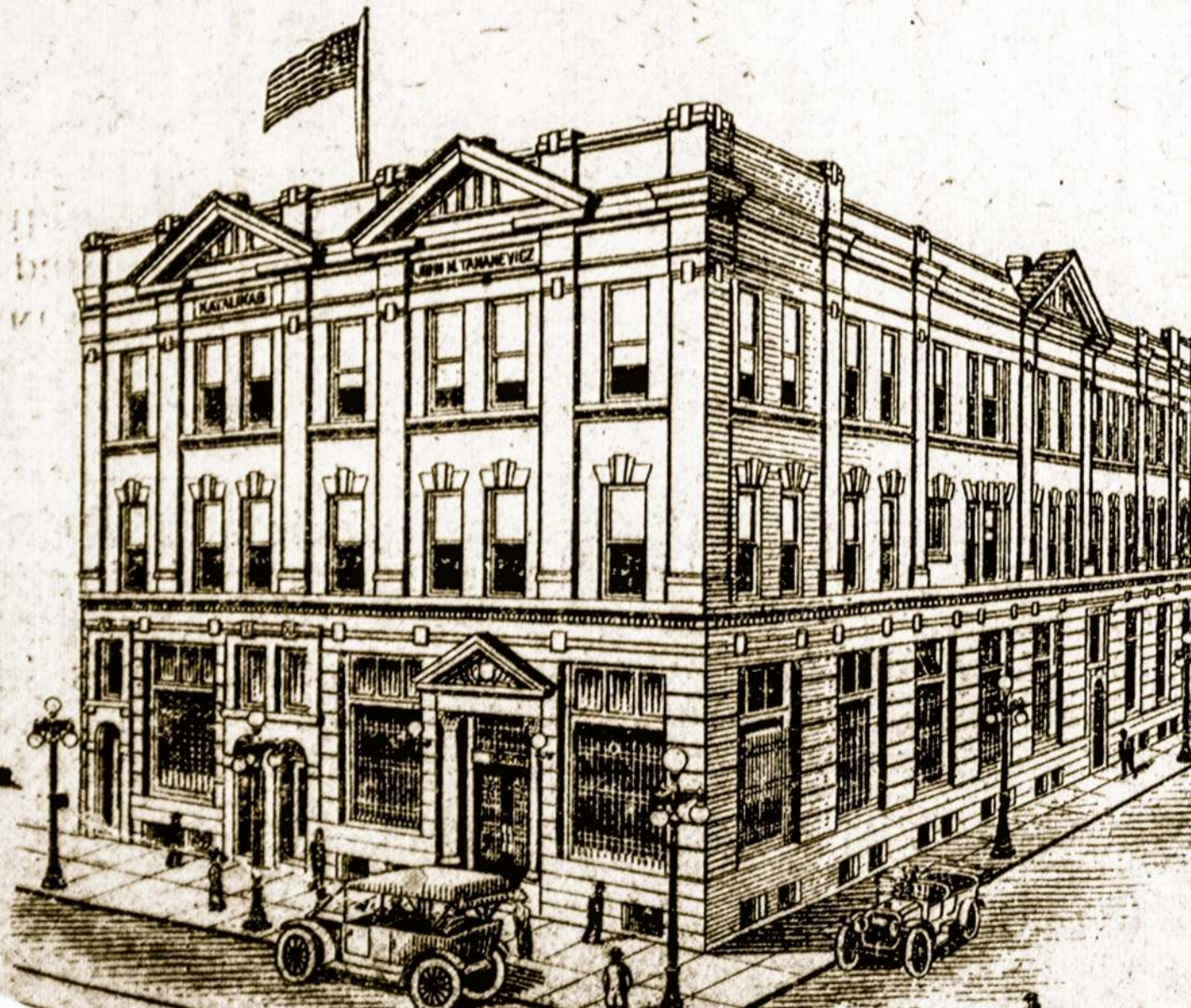
TANANEVICZ SAVINGS BANK Namai

Prieš Kalėdas ir Naujus Metus tarp lietuvių gyvuoja gražus paprotys — kuomi nors apdovanoti sau mylimas ypatas. Daugiausiai tėvai rupinasi suteikti dovanas savo vaikams, broliai seserims ir t. t. Todėl šiomis šventomis nerastum gražesnes dovanos kaip