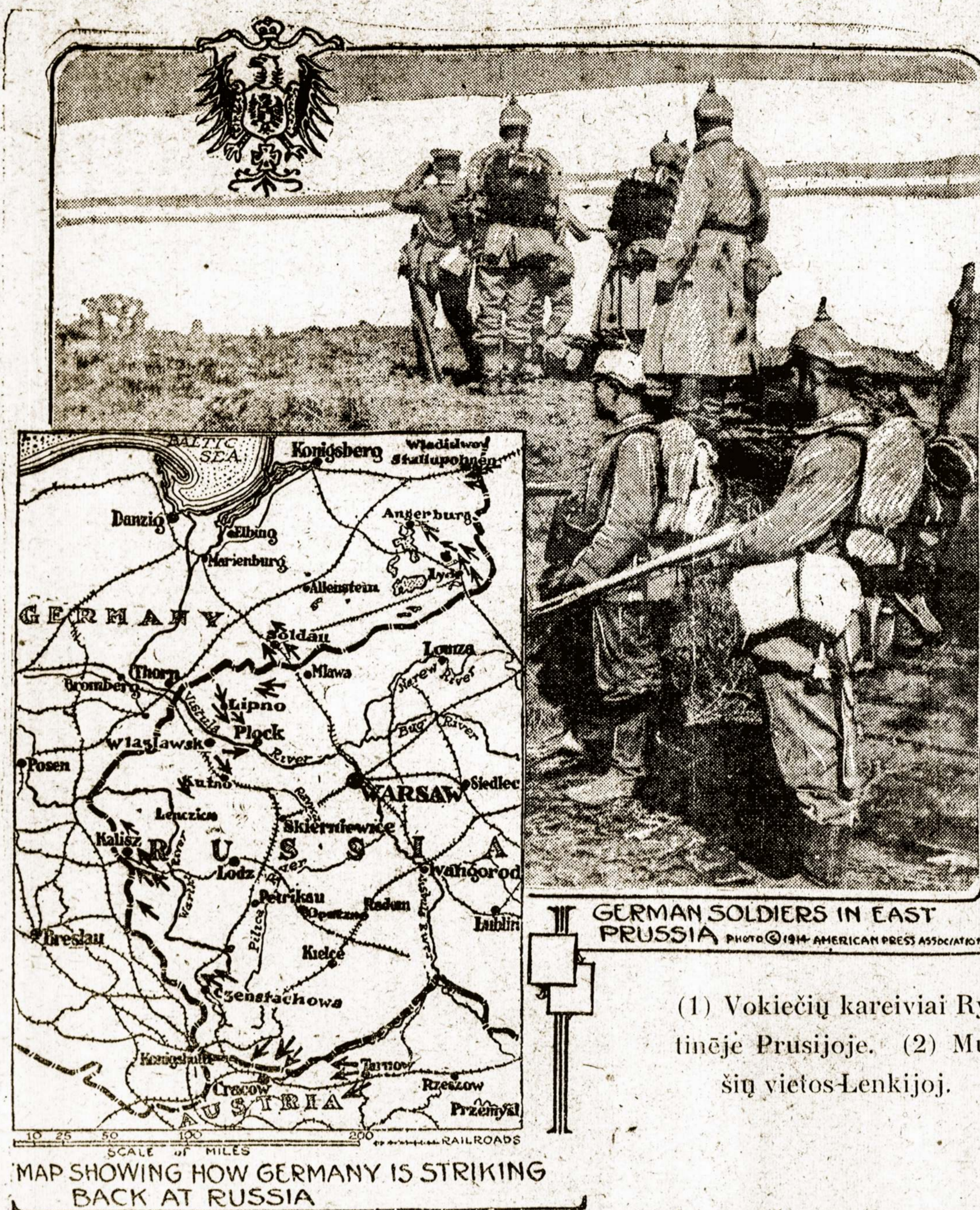
GERMAN SOLDIERS IN EAST PRUSSIA

(1) Vokiečių kareiviai Ry- tinėje Prusijoje. (2) Mu- šų vietos Lenkijoje.