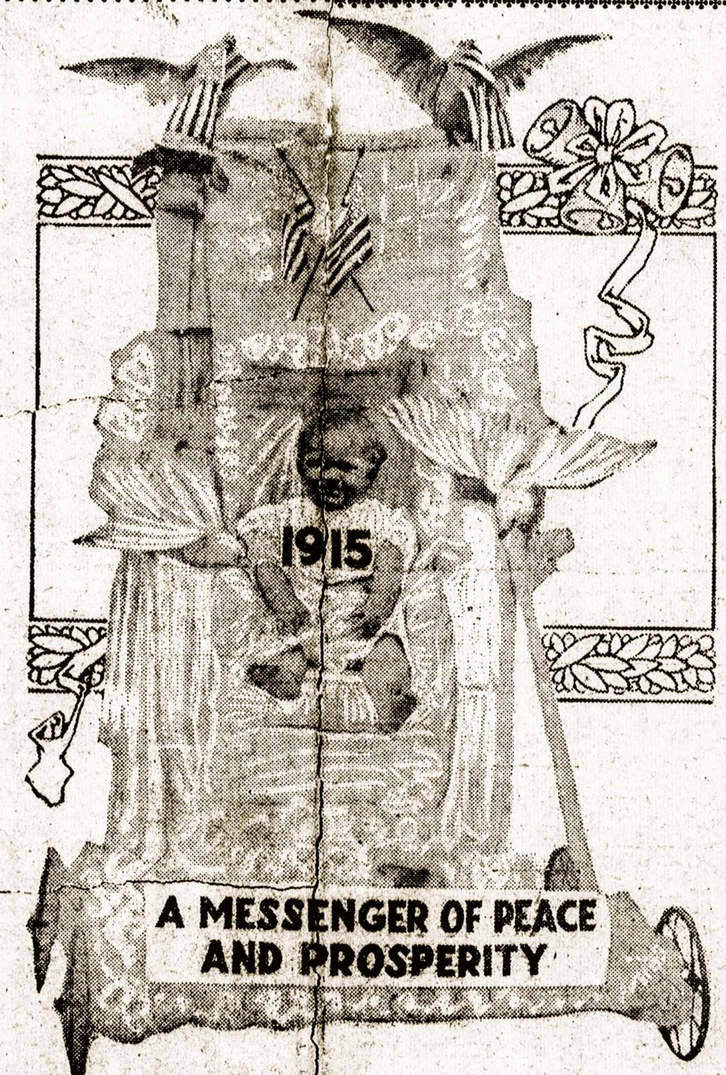
Ar ištikro naujieji metai bus taikos ir gerovės pranašu?