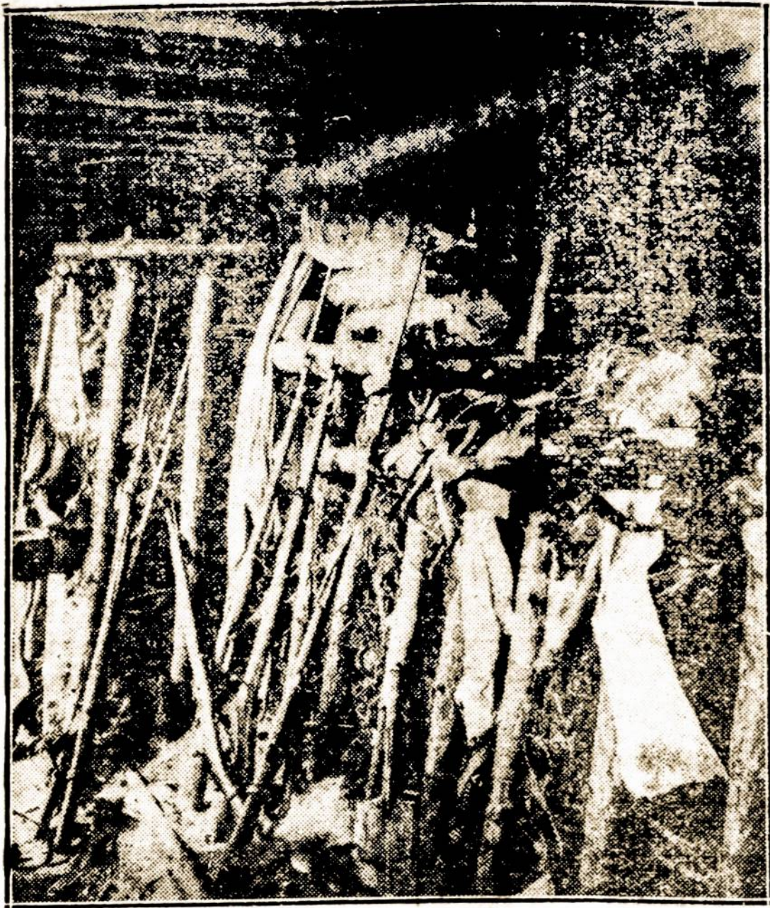
Rusų apleistos trašėjos ties Lomža.

Mums rodos, kad "Kova" be reikalo peikia tą Socialistų Partijos Pildomojo Komiteto su- manymą. Pild. K-as, be abe- jonės, ir pats netiki, kad Wil- sonas išsivadėtų kapitalistų kle-