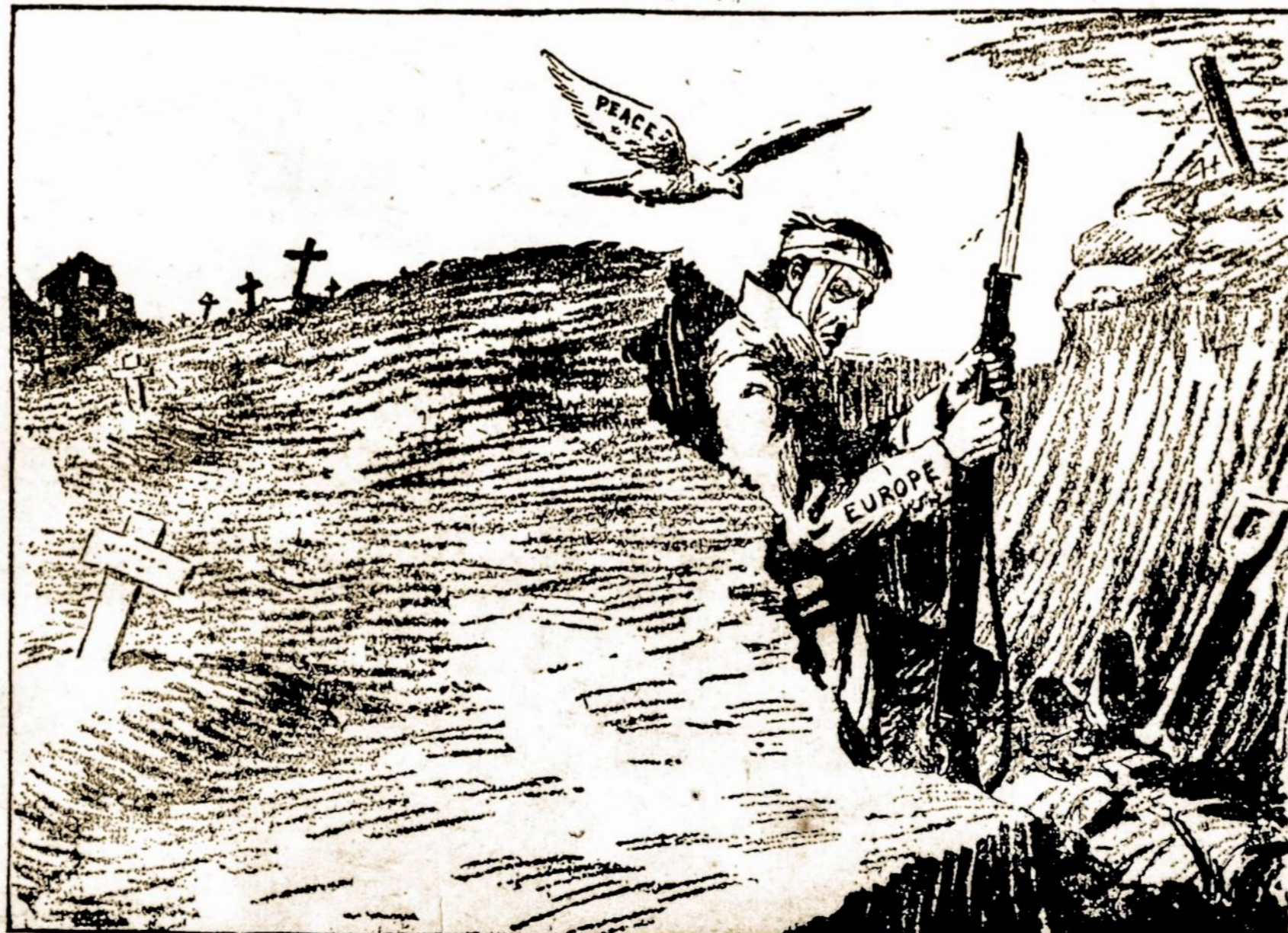
—Harding in Brooklyn Eagle.

WASHINGTONAS, sausio 4. — Prezidentas Wilsonas atvyko Washingtonan 7:55 val. ryte. Jisai tiesiai atsilankė Baltajin Naman. Prezidentas rengiasi sušaukti visą eilę konferencijų išdirbimui draug su įymesniais politiškasi veikėjais veikimo plenų.