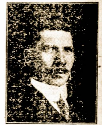
Ingaliotas "Naujienų" administ- ratorius.

svetainėje. Choro repeticijos atsibuna redomis 7:30 val. vakarė. Teatru rep- cijos atsibuna pėtnyčiomis, 8-tą val. v. Tai gi, jauni vaikiniai ir merginos, jei m- lite prasliavinti dailėje, kaip tai daine ar teatru lošimuse, tai kviečiam pri- lėti prie Jaunų Lietuvių Am. Taut. Klubi- nes J.L.A.T.K. nevien tik užsiima dainomi lošimais, bet taipgi ir pašelja ligoje. Ta- gi, kiekvienas lietuvis ir lietuvaite priva- prisidėti prie jo auklėjimo. Su pagarba, J.L.A.T.K.