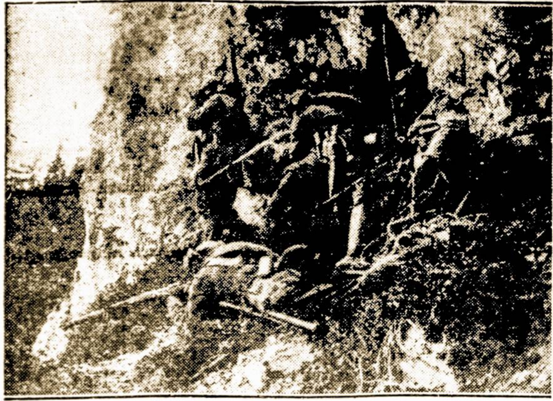
Vokiečių žvalgai užsislėpę už kalno daboja priešų pozicijas.

Jau sugrįžti, kol nuėjus traukinys su mano vaikeliais. Iš Cesvainės išvažiavom dešimtoji valandoj. Kadangi iki Valkui 115 varstų, tai prisiėjo važiuoti iki vakarui, iki 9 valandai. Keliu važiujant reikia kantrybės turėti. Vaikai našlaičiai rauda savo tėvų; moteris, nežinodamos kur jas veža, ir koks lietas jū laukia, taipgi neatsilieka; o mažiukai, alkį ir šaltį kęsdami, blyauna, kol sveikatos turi. Seniukai vaičioja, — nėra kur atsistėti, arba ir sėdėdami ant grindų, ir tai ant galo nuvargsta. Nebežinodamas, kaip juos nuraminti, paprašiau jaunesnes moteris ir mergaites, kad uždainuotų. Tas labai "mačijo" aptildymui liudny mano keleivių. Tai taip perleidom didesnę pusę kelio. Skambėjo lietuvių tautiškos dainelės, ir buvo padainuota keletas latviškų. Iš to visi buvo labai patenkinti. Apie 9 valandą vakaro atvykau į sau paskirtą stotį Valkas II. Ji už 2 varstų nuo miesto. Vėl tuoj pat vydytis vežėjus ir suvažiavom į miesto prie-