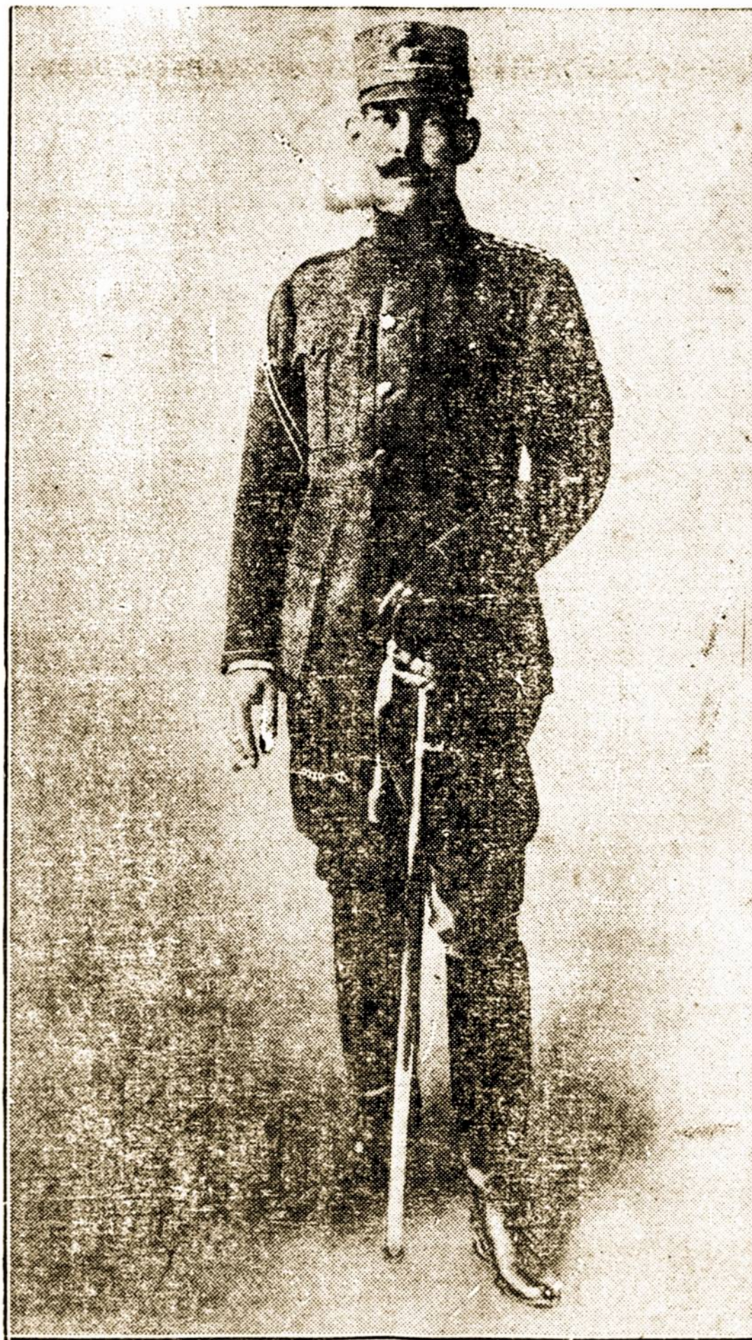
Konstantin I., König der Serben.

NEW YORK, sausio 19. — Margaret H. Sanger, kaltinamos platinime literatūros apie gimdymų kontrolę, byla vakar liko atidėta neaprubėvotam laikui.