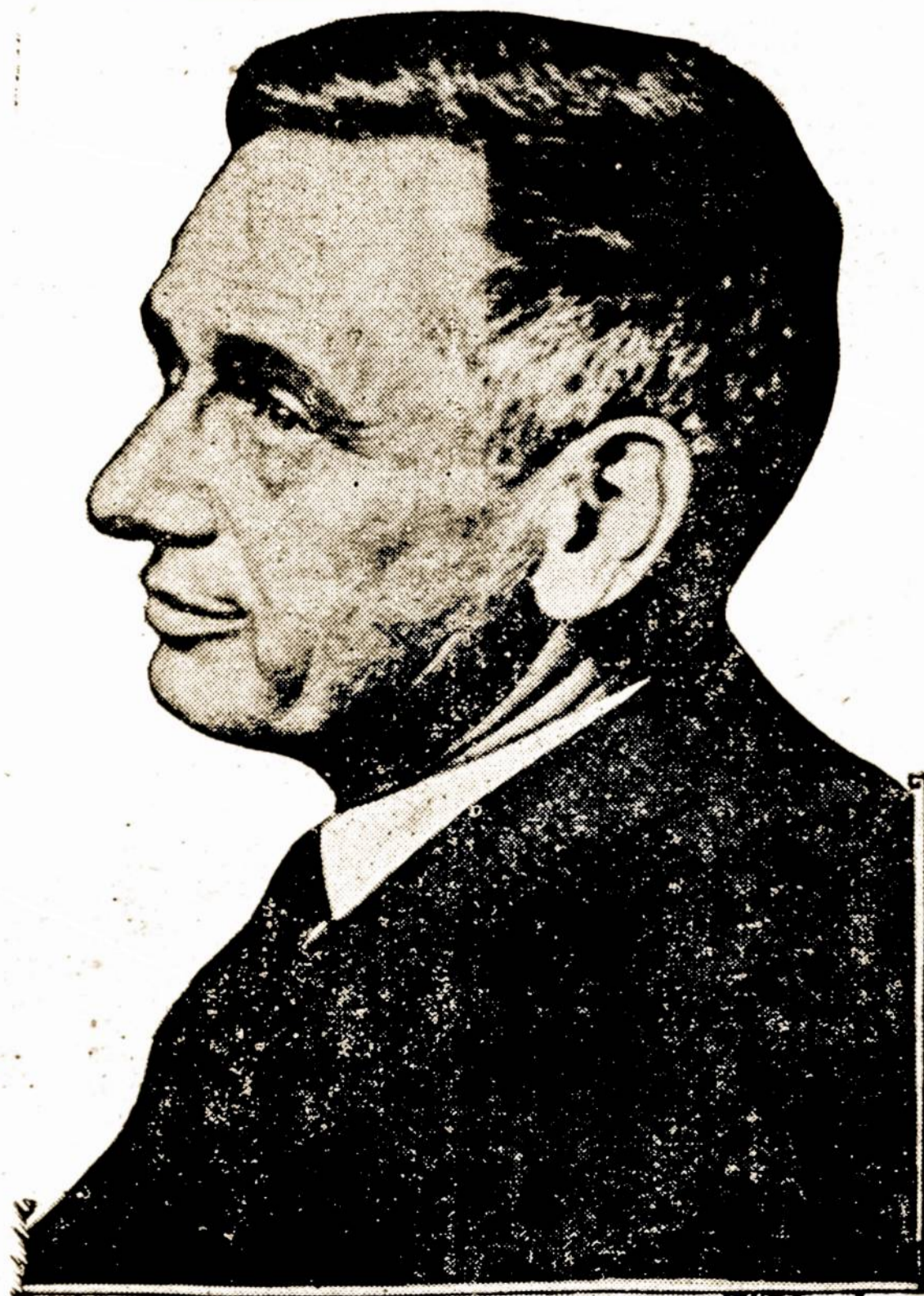
LOUIS D. BRANDEIS

UTICA, N. Y., vas. 3. — Gai-sras sunaikino kelias Savage Arms Co. pašiures.