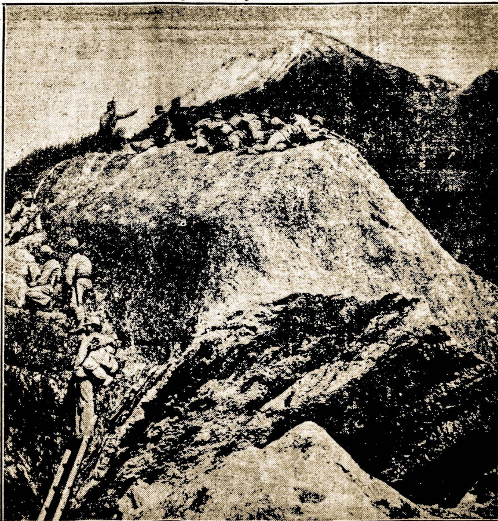
Austrų kareiviai lipa ant kalno, kurį rengiasi užpulti italai.