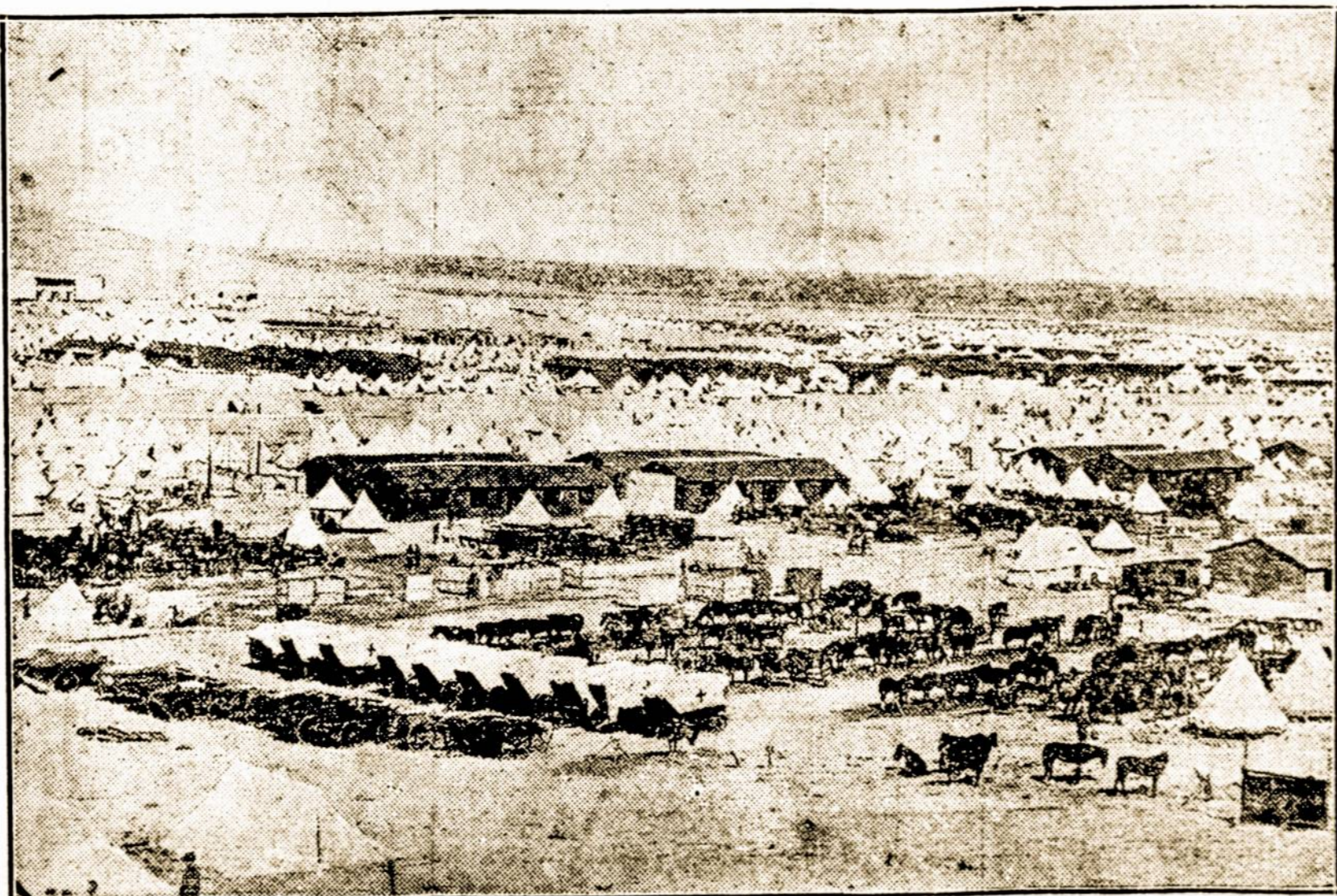
Anglų stovykla Egipte.

PETROGRADAS, vas. 29. — Dumos finansų komisija, pirmininkaujama premjero Strumer patvirtino naują paskolą sumoje $1,020,000,000. Ant paskolos bus mokama 5½%.