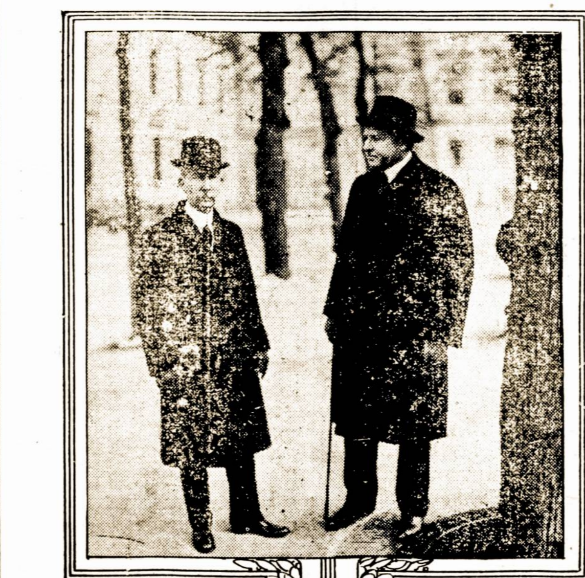
Pulkininkas Edward M. House (kairėje), ypatingas Wilsono pasiuntinys ką tik aplankęs visas kariaujančias šalis, su Suv. Valstijų ambasados palydovu Berline.

AMSTERDAM, kovo 1. — Ypre ir Dixmude apskrityje, (Belgijoje) vokiečių pusėje pastebiamas smarkus judėjimas. Laukiama, kad ir čia jie pradės smarkų ofensivą.