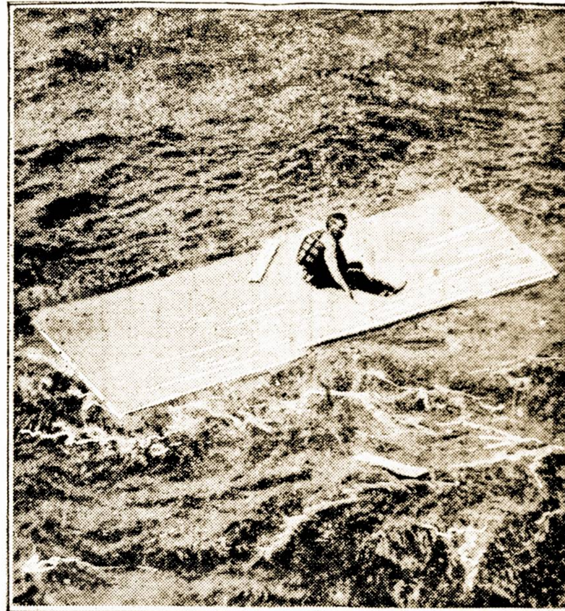
Jurininkas nuo paskandinto laivo išsigelbėjęs ant lentos.

upės kranto į šiaurę ir nuo Verduno smarkiomis atakomis bandė atsimiti pralaimėtas pozicijas, bet nepasisekė ir jų visas atakas vokiečiai atmušė.