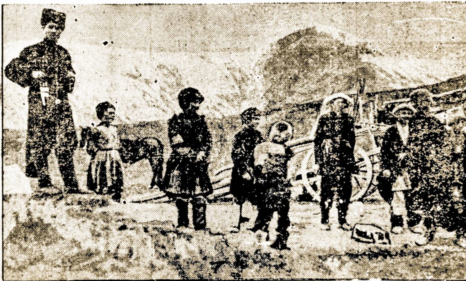
Tipai Kaukazo gyventojų: —Gruzinai.